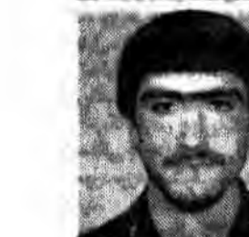
بسم رب الشهداء