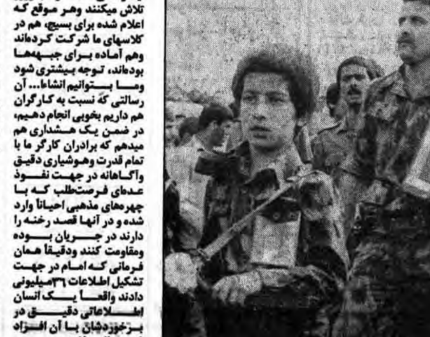
از کوچک و بزرگ، پیر و جوان، یک دست قرآن یک دست سلاح در روبروئی با کفر جهانی

آرزوی ماست که ساتلان میکنیم و تحقیق بپوشیم به این واقعیت و در تاریخ اسلام داریم که مسلمین صدر اسلام در خانه‌هایشان همانگونه که مطرح بود و از اهمیت ویژه‌ای برخوردار بود، داشتن سلاح و احیاء با سلاح‌های متناسب با آنروز مانند زره سپهر، کلاهخود و وسایلی که میبایستی داشته باشند در خانه‌هایشان بود، بطوریکه مائیسیم که یک عده لشکر هستند، برای حفاظت تفکر اسلامی و موسزهای اسلامی و بقیه هم نیروهای هستند ارتشی که در دل جامعه مشغول کار و فعالیت و تلاش هستند در کشاورزی، در فرهنگ، در بازار و خلاصه اینطرف و آنطرف و به مجرد اینکه فرمان فرمانده کل قوا میسرود میسرود میسرود میسرود