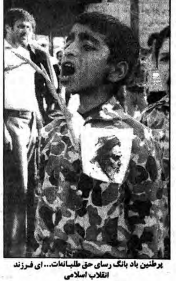
برترین باد بانگ رسای حق طلبان، آذر فرزند انقلاب اسلامی

س: برادر سالک لطفنا، مورد بخش سیاسی، بسیج مستضعفین در سپاه ادغام شد، از زمانی که بسیج در سپاه ادغام شد باز یک حرکت جدید بوجود آورد، امید فرستادگان و نفوذ کنندگان را ناامید کرد و آنها مایوس شدند، امپریالیسم فکر میکرد که میتواند با قدرت بسیج حرکتی را علیه جمهوری اسلامی بسازد، اما بعد از انقلاب و درگیری‌های که بنی‌صدر در این رابطه داشت و خواسته‌های بنی‌صدر، با این ادغام خشی شد، و نیروهای که میسرود شکل ارگانهای مخالف در آمد و شاید نهایتاً بر اثر بی‌توجهی مسکن بسود یک وقتی فرصت طلبان از آن سواستفاده میکنند، با این ادغام همه نقشه‌ها و همه امدها خشی شد و از بسین برای عضوگیری خودشان، سپاه پاسداران انقلاب اسلامی با قدرت کامل با تشکل و سازماندهی و آموزشهای لازم تلاش میکند تا مدافع اسلام و نگاهبان خون شهدا باشد و ما در شرایط فعلی آماده‌ایم که کلیه نفوذ و نفوذ ضعیف را که میسرود ما در طرف بکنیم و تا خدمت است همیشه در صحنه‌ها باشیم.