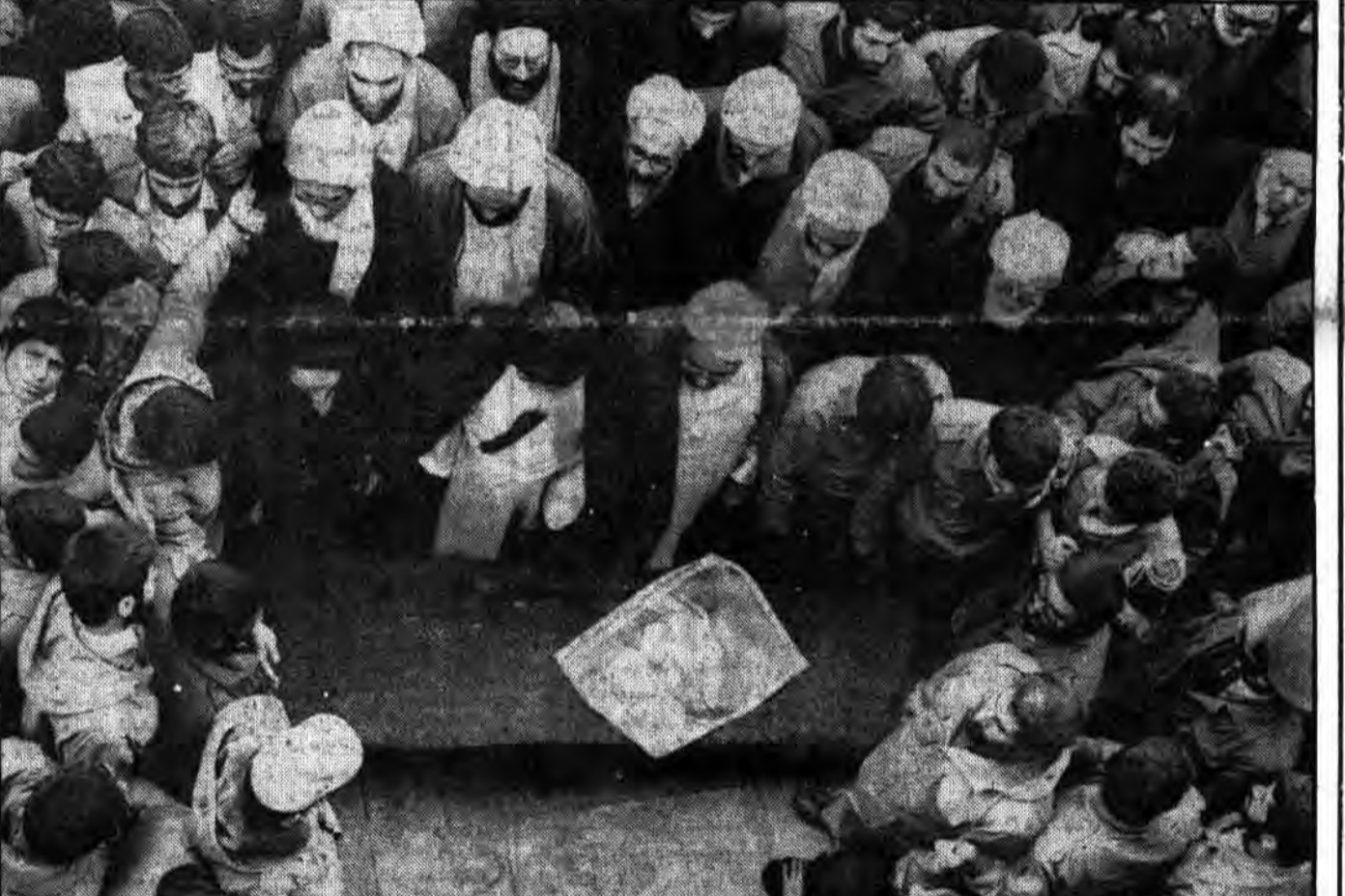
آیات عظام و علمای اعلام و نمایندگان شورای عالی قضائی، مجلس شورای اسلامی و اساتید حوزه علمیه قم و اقطار مختلف مردم بر پیکر پاک علامه طباطبائی نماز می‌گذارند.

دیروز در مدرسه عالی شهید مطهری: مردم تهران یاد فیلسوف شرق، عالم ربانی آیت‌ا... طباطبائی را گرامی داشتند • مردم سراسر کشور با شرکت در مجالس بزرگداشت به سوگ رحلت علامه طباطبائی نشستند. • سیل تلگرامها و پیامهای تسلیت در فقدان آیت‌ا... علامه طباطبائی در صفحه ۱۰