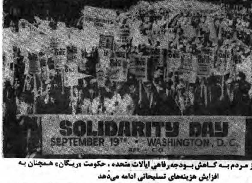
با وجود اعتراضی پاره ای از مردم به کاهش بودجه راهی ایالات متحده، حکومت «ریگان» همچنان به افزایش هزینه های تسلیحاتی ادامه می دهد

ایالات متحده برای آن که ایجاد نیروی واکنش سریع و افزایش توانایی برای مداخله نظامی در بخش های جهان و خاصه در خلیج فارس، آسیای شرقی و آمریکای لاتین را تسریع کند، اکنون روی توسعه، تولید و به کار گرفتن همه انواع سلاح های وحشتناک تاکید می کند