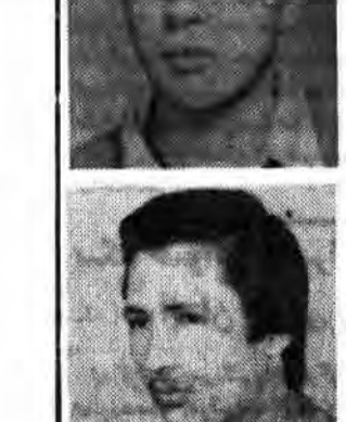
بسم رب الشهداء والصدیقین