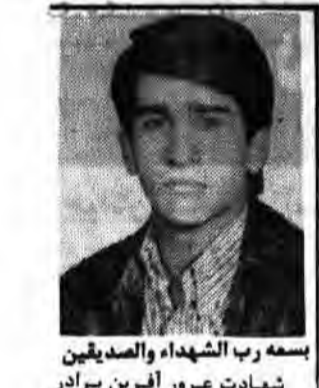
بسمه رب الشهداء والصدیقین