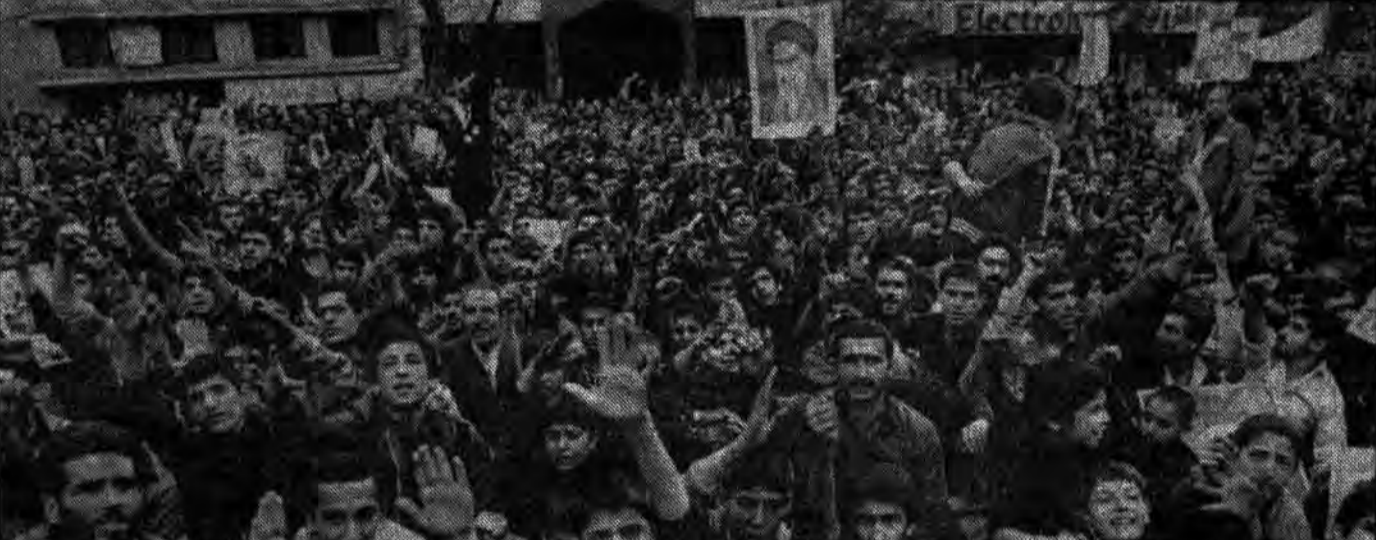
در سالروز دیگری از تصرف لانه جاسوسی، تبعید امام و روز دانش آموز، دانش آموزان کشورمان به همراه معلمین خود و سایر مردم بار دیگر کاخ سفید را با شعار مرگ بر آمریکا لرزاندند

رژیم صدام به شرکت مزدوران مصری در جنگ علیه ایران اعتراف کرد