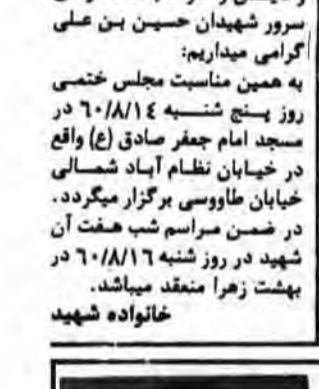
بسم رب الشهداء والصدیقین