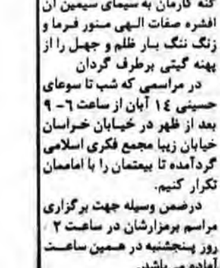
بسم رب الشهداء والصدیقین