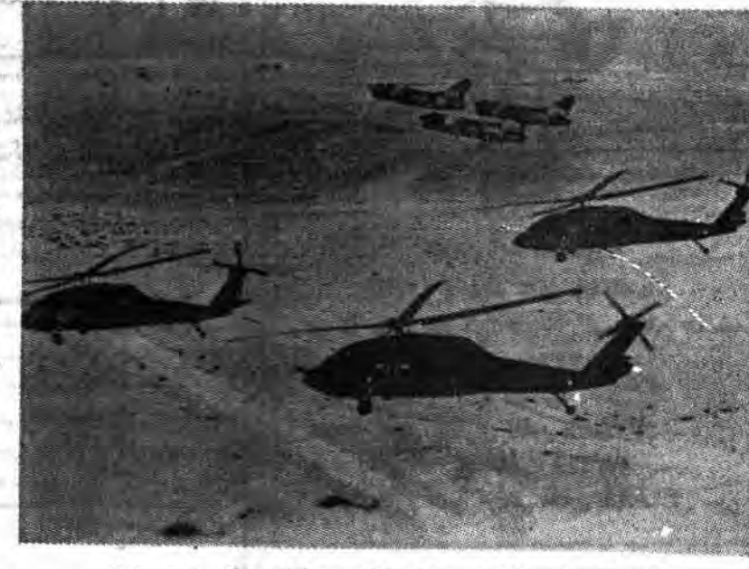
آمریکایی‌ها می‌خواهند «مالت» را هم به آرايه جنگی خود ببندند

روابط کشور جزیره‌ای مالت با ایالتی که تنها چندماه پیش با اعضای یک پیمان دفاعی و کمکی صمیمانه بود، به سردی گرایده است. براساس این پیمان، ایالتی وعده داد که از بی طرفی «مالت» به نحو فمالتی دفاع کند. رهبران حزب حاکم کسارگر در «والتا» (پایتخت مالت، رم و واشنگتن را متهم کرده‌اند که قصد دارند که کشور بی طرف مالت را به یک پایگاه کامل «ناتو» تبدیل کنند. عامل اصلی این وضع، بدگمانی ژرف حکومت «مالت» درباره نقش ایالتی به عنوان یک