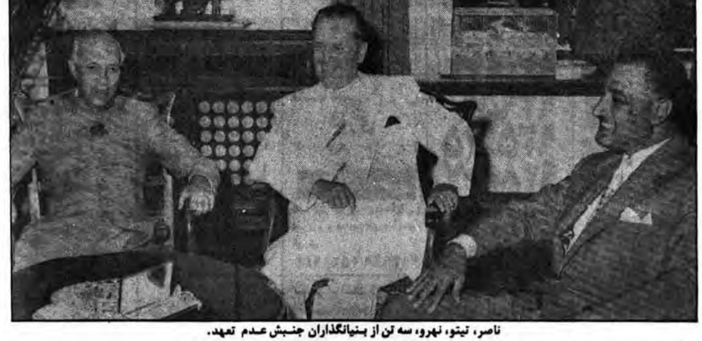
ناصر، تیتو، نهرو، سه تن از بنیانگذاران جنبش عدم تعهد.

از مجله «مروی برامور بین المللی» چاپ بلگراد نویسنده: ب بالگونیک، استاد دانشگاه زاگرب مترجم: سید محسن شیرازی