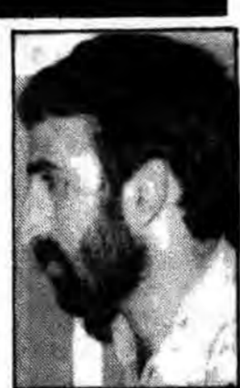
بسمت استادی سید علی خامنه‌ای ریاست محترم جمهوری اسلامی ایران