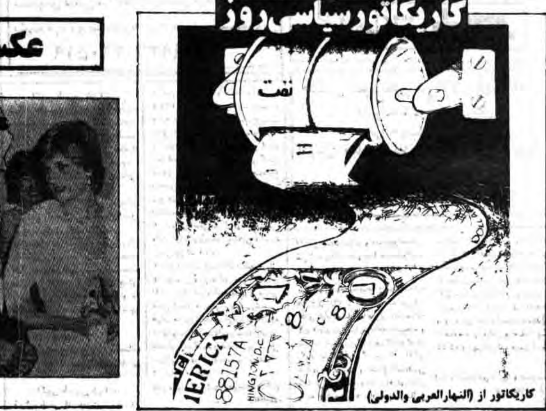
کاریکاتور از (النهار العربی والدولتی)