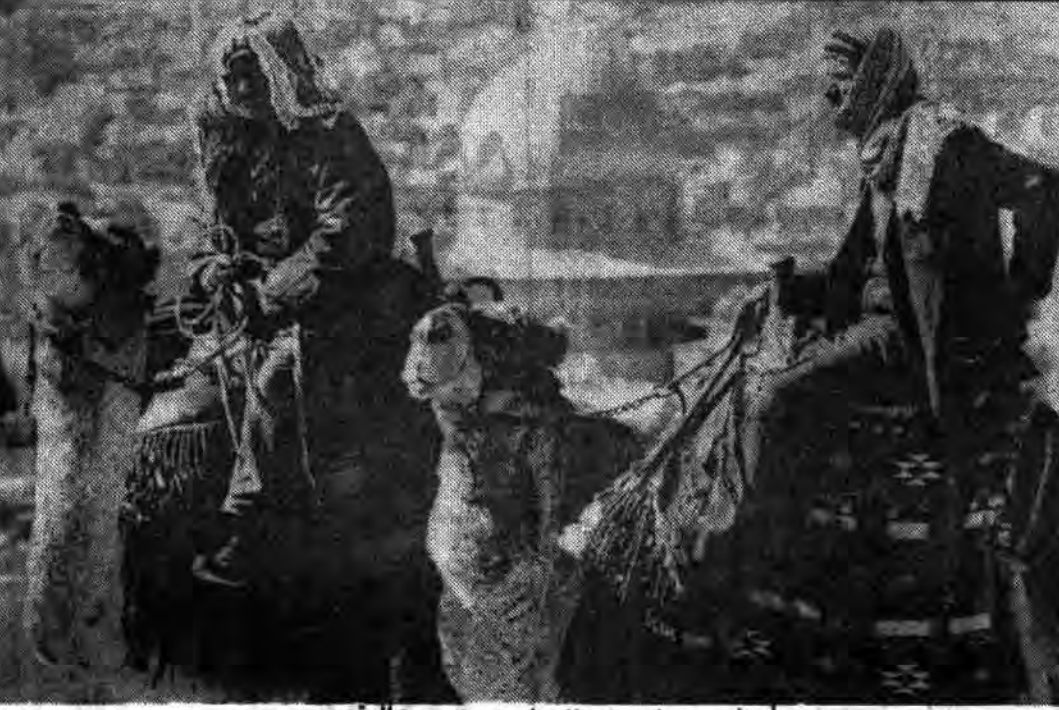
سیماي غمزده اعراب فلسطینی در بیت المقدس

آیا آمریکا که ضامن بقای اسرائیل است می‌تواند حافظ اراضی مقدس اسلام باشد؟