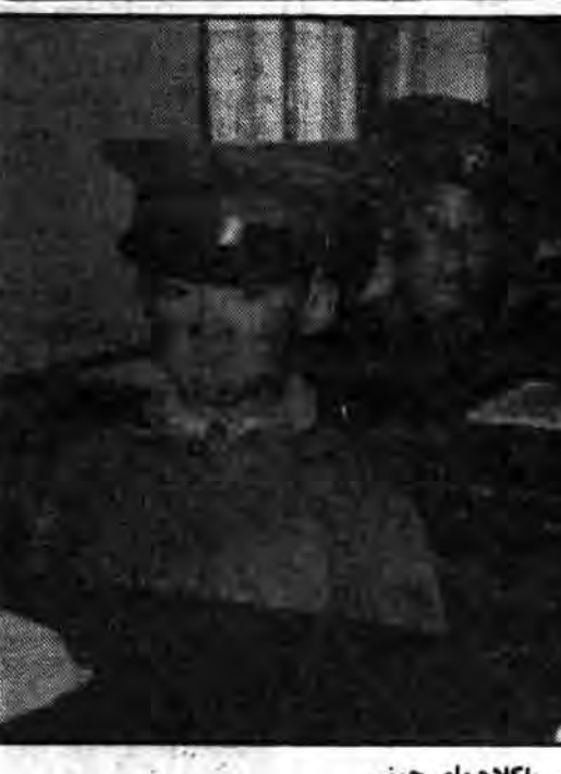
دانش آموزان تبتی با کلاه‌های چینی

عامل بزرگی که در زیر شکست چین در تبت قرار دارد، چیزی نیست. ● چینی می‌نماید که «تروتسک‌شدن» ● آیا تبت هم چنان اجازه یابد تا به سوی نوعی از سوسیالیسم حرکت کند که بیش از آن که چینی باشد تبتی است ● دالایی لاما می‌گوید: مسأله اصلی، سعادت خلق ماست. همین که خلق تبت عملاً - نه موعلاً - ارضا شود، آن وقت من بازخواهم گشت.