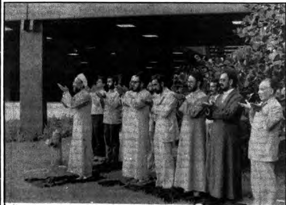
در عکس، گروهی از اعضای هیات ایرانی شرکت کننده در کنفرانس بین المللی در حال بجای آوردن نماز...