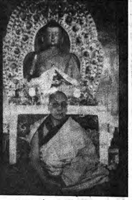
دلایلی لاما رهبر مذهبی چین

نشان می‌دهد این‌ها دارند که مسأله اقلیت‌ها را بسیار ساده انگارند. همه این موضوعها در تیت صدق می‌کند. در آنجا سیاست رسمی، خاصه سیاست رسمی در اتساع انقلاب فرهنگی، با تلاش‌هایی مشخص می‌شد که برای چینی کردن تبتی‌ها و ناسود کردن شیوه ملی زندگی صورت می‌گرفت. این وضع را خاصه در تسلطی می‌توان دید که مقامات «هان» (چینی) سر حرس و سر باز می‌رند و تحصیلات متوسطه اقلیت‌ها کاملاً به زبان چینی است. نظام و کمون و تغییرات بزرگ دیگر، بدون توجه به آداب و شرایط محلی سرقرار شده است. خلق‌های چادرنشین، به زور اسکان داده شده‌اند و گندم که «هان‌ها» (چینی‌ها) آن را مصرف می‌کنند، جانشین محصول اساسی تبتی، یعنی حو، شده است.