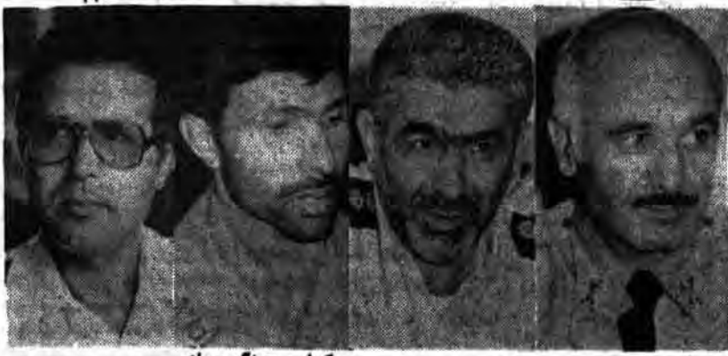
تیمسار ظهیر نژاد سرکار سرهنگ معینی سرکار سرهنگ صیاد ناخدا الفضلی فرمانده رئیس ستاد مشترک پور فرمانده نیروی هوایی شیرازی فرمانده نیروی زمینی

جمهوری اسلامی یکشنبه ۱۲ مهرماه ۱۳۶۰ - شماره ۶۷۶ - سال سوم - ۱۴۰۱ - ذیحجه ۱۴۰۱ - شماره ۶۷۶ - سال سوم - ۱۴۰۱ - ذیحجه ۱۴۰۱ - شماره ۶۷۶ - سال سوم