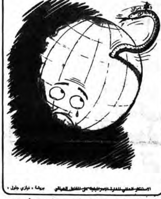
این افغانی، همیشه در کمین بشریت است (کاریکاتور از: مجله العوادت چاپ لندن)