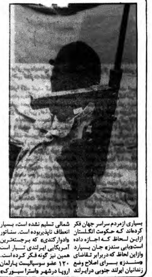
بسیاری از مردم سراسر جهان فکر شمالی تسلیم نشده است، بسیار کرده اند که حکومت انگلستان انعطاف ناپذیر بوده است. سناتور

کرد پناه، بلکه آن است که آباتیچه این تحول جدید، آرمان مبارزه یی را به پیش خواهد برد که «ارتش جمهوری خواه ایرلند» و اقلیت کاتولیک را برلند شمالی برای حقوق کامل اقتصادی، اجتماعی، سیاسی و مذهبی انجام می دهد. در برابر این تقاضا است که حکومت انگلستان با هزینه بسیار قابل ملاحظه جداً مقام کرده است. باین همه، در حالی که به سختی می شد انتظار داشت که حکومت انگلستان در برابر این نوع فشار تسلیم بشود، این حکومت اکنون یابد بهای مرگ و بایبساندزه را محاسبه کند. آیا مرگ «سندز» به آرمایی کمک کرده است که او به خاطر آن تصمیم گرفت جانش را فدا کند؟ حکومت انگلستان گفت مرگ «سندز» به این آرمان کمک نکرده است و ادا کرده که در زست بیهوده یی بیش نبوده است. اما حتی یک تحلیل «عجولانه» نشان خواهد داد که ادهای حکومت انگلستان درست نیست و