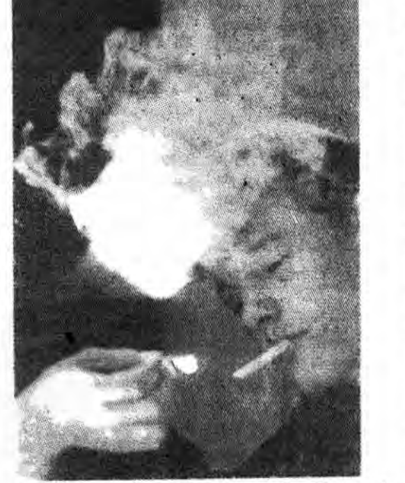
از ۱۲ سالگی تاکنون معتاد به ماری‌جوآنا بوده و میگوید که از جوانیش هیچ چیز بیاد ندارد.

خطر ناک می‌باشد. امروزه این مایه آساف است که مراکز درمان اعتیاد، از پذیرفتن معاندین به ماری‌جوآنا امتناع می‌ورزند. بعنوان مثال، یک نیویورکی ۲۷ ساله که هفته‌ای ۲ اونس (۱۷/۳) مصرف می‌کند از هیچ جای دیگر مدتی آنرا به بیمار خود بحت و گفتگو می‌کنند و از همدیگر حمایت می‌گیرند. هر دو مؤسسه در هدف جلوگیری و ممانعت از بیماران به دسترسی داشتن اینگونه مواد معتقدند و تنها فرق آنان اینست که یکی بگونه «شریت خوری» و دارو، دیگری بطور آزاد با بیماران خود عمل می‌کند، اما ۲۵۰ دلار است. آقای ریلی میگوید: شاید این برنامه‌ها پاسخی به احتیاجات اجتماعی باشد، اما ۶۰ ساله‌ها در نظر گرفته نشده است حال آنکه، ماری‌جوآنا برای مصرف کنندگان کهن سال بسیار حاد و