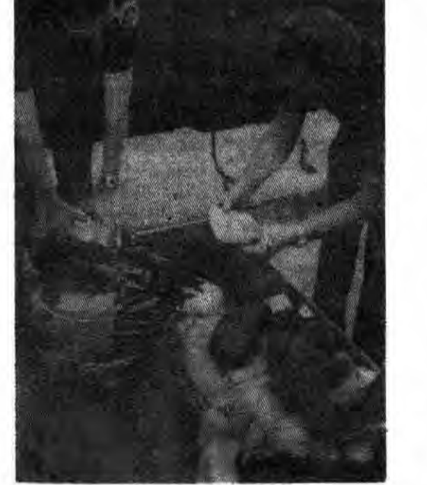
برای سرمایه‌دار، هیچ تجارتی سودآورتر از مواد مخدر نیست حتی تجارت اسلحه.