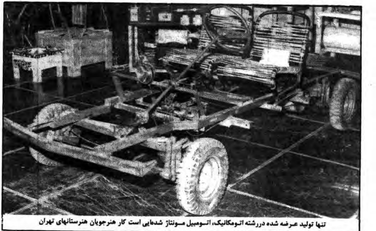
تنها تولید عرضه شده در رشته اتومکانیک، اتومبیل مونتاز شدیدی است کار هنرجویان هنرستانهای تهران

* در این نمایشگاه، تولیدات ۳۹ هنرستان تهران در بیش از ۱۷ رشته و ۱۰۰۰ قطعه به معرض نمایش گذاشته شده است. * برای رسیدن به استقلال فرهنگی، ضرورت اقتصادی خود کفا و مستقل هرچه بیشتر احساس میشود. * تربیت نیروی انسانی جوان و متخصص، برای رسیدن به اهداف انقلاب و از جمله استقلال واقعی یکی از شروط اصلی و اساسی است. * مقداری از تولیدات هنرستانها شامل قطعات سفارشی ارتش و کارخانههای مختلف است. * در یکی از هنرستانها، قالبی بسمبلغ بالاتر از ۵۰ هزار تومان تولید و در بازار فروخته شده است. * هنرجویان هنرستانها: وسایل کار اندک است و باید از وجود ما در زمینه کارهای عملی استفاده شود. * بعد از انقلاب اسلامی، بسیاری از کتب درسی هنرستانها تغییر یافته و در جهت نیاز جامعه بدور از صنایع مونتاز تألیف شده است.