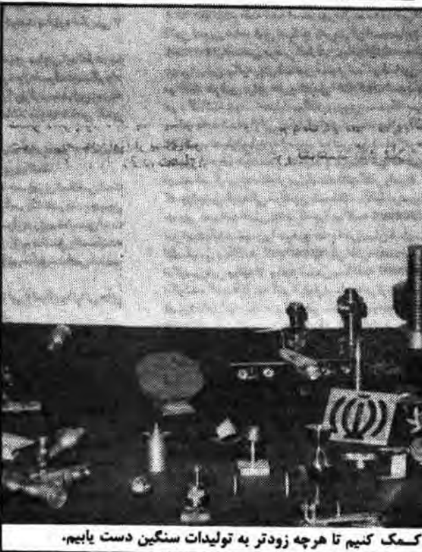
این قطعات کوچک نشاندهنده آغاز کار است، باید همه کمک کنیم تا هرچه زودتر به تولیدات سنگین دست یابیم.

تربیت نیروی انسانی جوان و متخصص برای رسیدن به اهداف انقلاب و از جمله استقلال واقعی یکی از شروط اصلی و اساسی است که این امر مسور نمی گردد الا به داشتن مراکز آموزشی، که از ابتدا باین هدف به آموزش و پرورش نیروها پرداخته. در حال حاضر یکی از مهمترین مراکز تربیت نیروی انسانی سراسر کشور، هنرستانهای صنعتی محسوب میشوند که با توجه به مشکلات بسیاری که از گذشته در این مراکز پیش می خورد بگونه ای امیدوار کننده به امر آموزش نوجوانان مشغول هستند تا با تولیدات داخلی، به خود کفائی برسیم. بر پائی چنین نمایشگاهی می تواند آغازی بر این حرکت باشد. یکی از مسئولان برگزار کننده نمایشگاه در مورد