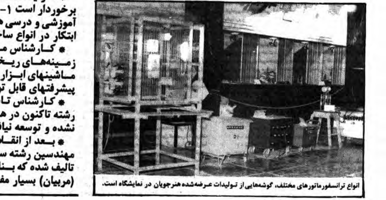
انواع ترانسفورماتورهای مختلف، گوشههایی از تولیدات عرضه شده هنرجویان در نمایشگاه است.

* تولیدات هنرجویان از دو ویژگی برخوردار است ۱- مطابقت با برنامه های آموزشی و درسی هنرستانها ۲- خلاقیت و ابتکار در انواع ساختهها * کارشناس ماشینهای ابزار: در زمینه های ریخته گری، ذوب فلزات و ماشینهای ابزار، هنرستانهای کشور پیشرفت های قابل توجهی داشته اند. * کارشناس تاسیسات: متأسفانه این رشته تاکنون در هنرستانهای ایران شناخته نشده و توسعه نیافته است. * بعد از انقلاب اسلامی، با کمک مهندسین رشته ساختمان، ۱۶ کتاب جدید تألیف شده که بنا به گفته هنرآموزان (مربیان) بسیار مفید و سودمند هستند.