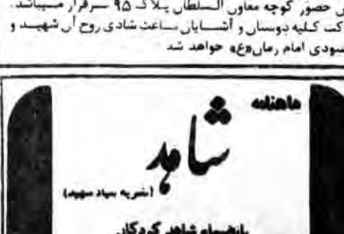
سرمربان شهدای گمنام