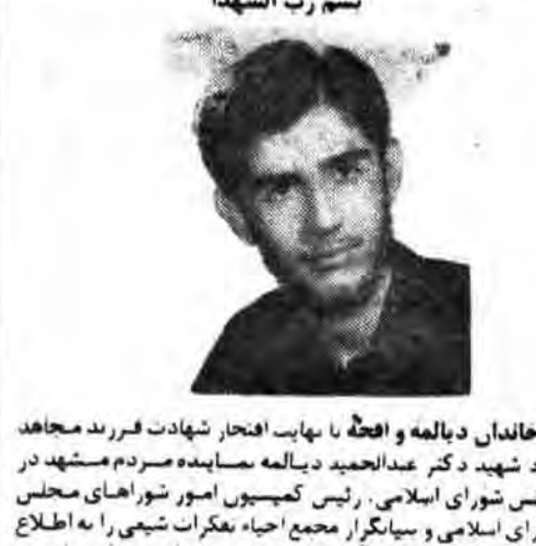
سرمربان شهدای گمنام