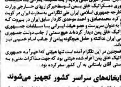
سرمربان شهدای گمنام