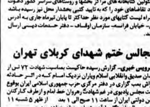
سرمربان شهدای گمنام