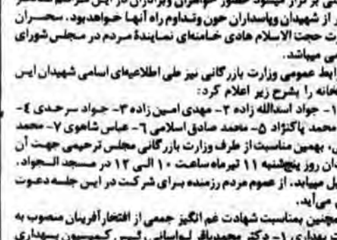
سرمربان شهدای گمنام