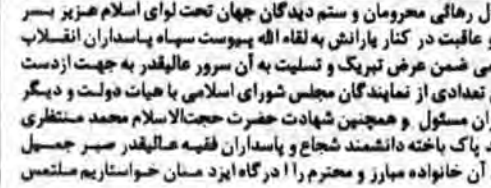
سرمربان شهدای گمنام