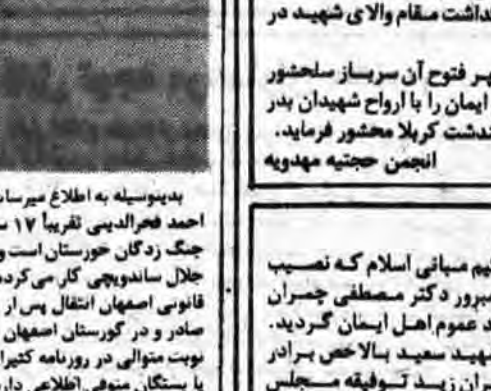
آقای سید کاظم حسینی، امام جمعه مینادوب