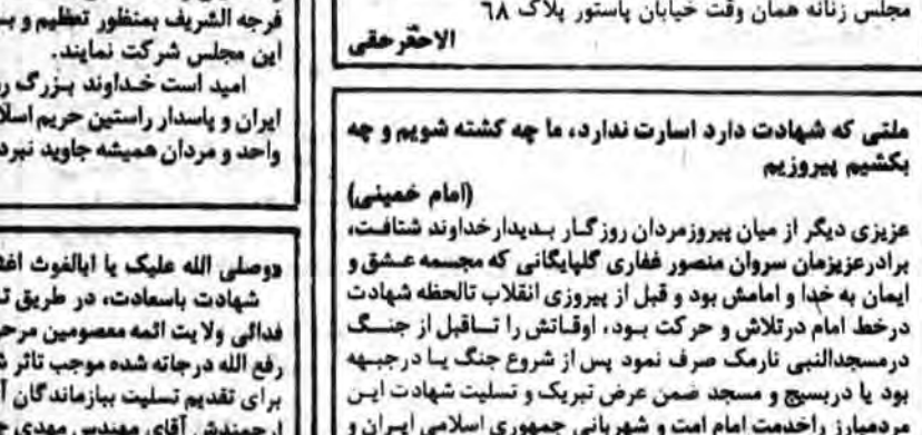
آقای سید کاظم حسینی، امام جمعه مینادوب