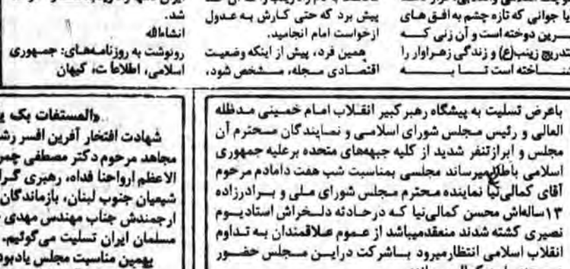
آقای سید کاظم حسینی، امام جمعه مینادوب