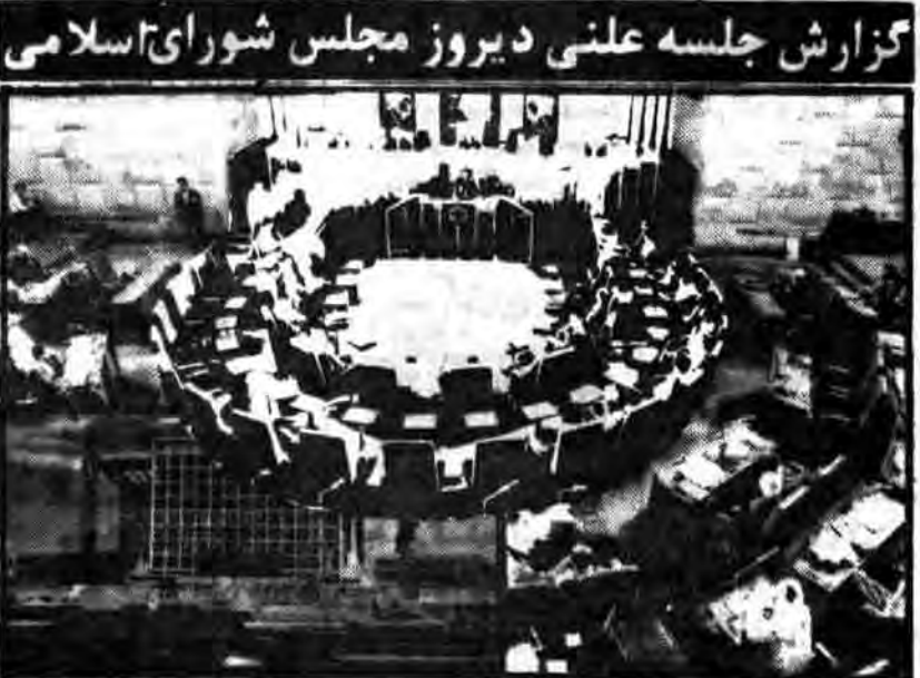
گزارش جلسه علنی دوازدهمین مجمع شورای اسلامی

جلسه شورای اسلامی صبح دوازدهم خرداد ماه ۱۳۶۰ دقیقه ۱۴ تا ۱۵ در محل اجتماعات مجلس شورای اسلامی و در میان حضور اعضا و مسئولان مختلف برگزار شد. در این جلسه در مورد مسائل مختلف و همچنین در خصوص مسائل جاری کشور بحث و تبادل نظر شد. در این جلسه در مورد مسائل مختلف و همچنین در خصوص مسائل جاری کشور بحث و تبادل نظر شد.