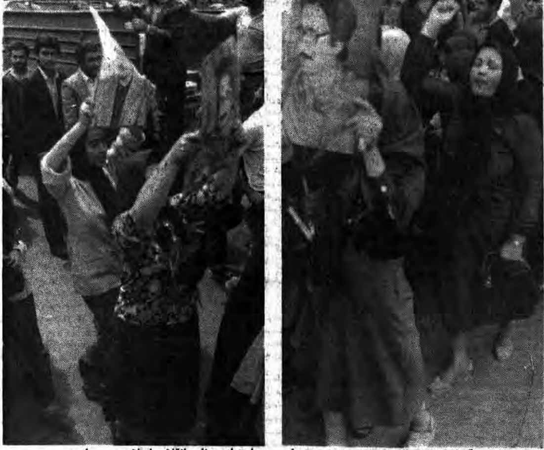
گوشه ای از تظاهرات دیروز در تهران بحمايت از روزنامه انقلاب اسلامی و میزان سخنرانی حجت الاسلام هادی غفاری امروز ساعت ۶ بعد از ظهر، مسجد موسی بن جعفر، خیابان ۱۷ شهریور، خیابان سعیدی (غفاری سابق)

۲۸ نفر از نمایندگان مردم تشنج آفرینی های اخیر را محکوم کردند