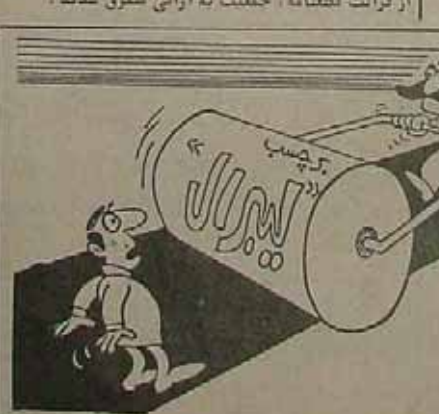
جاده صاف کن!

روزنامه انقلاب اسلامی صاحب‌مقاله: سید ابوالحسن علی‌صدر مدیرمسئول: محمد مجتهد سهروردی: سید جمال‌الدین موسوی: سخنان امام خمینی: مقال: داور پورست