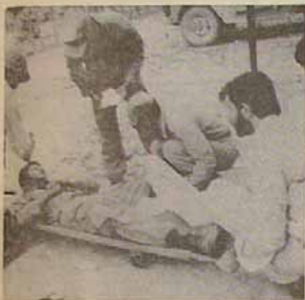
یکی از برادران سوزاک که هنگام عبور از شهر در دست مورد اصابت گلوله کلاشینکف ضدانقلاب واقع شده تحت معالجات اولیه قرار گرفته است پای چپ وی شدت آسیب دیده است

آخر آنها صادقانه خان خود را در طبق اخلاص نهاده و دفاع کردند.