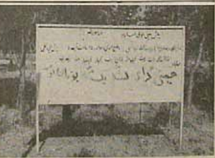
"حمیتی گرامی، لشکر یک مرکز فرمان توست" عبارتی است که یکی از سربازان محروم ارتش جمهوری اسلامی در واپسین لحظات عمر خویش با خوش روی تابلوئی در یادگان مهاباد نگاشت.

عظمی از ارتش را سربازان و افراد وظیفه تشکیل میدهند که اکثریت قریب به اتفاق آنان از جوانان مسلمان و منعقد می‌آیند و سایر پرسنل نیز برجسته از متن خلق که عموماً از بی‌بوری انقلاب‌نیز صداقت و صلاحیت خود را با انجام مأموریت‌های نظامی و حضور فعال در صحنه نبرد و جهاد با خداوند، به اثبات رسانده‌اند.