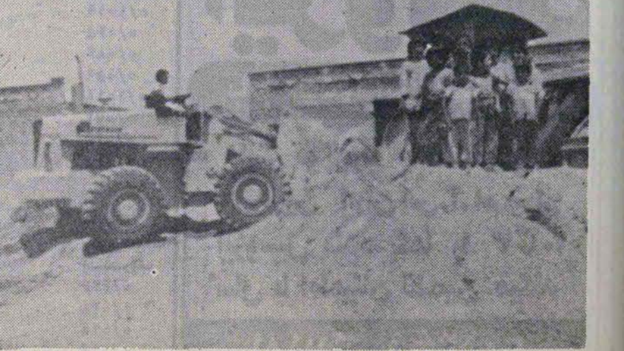
در علی‌آباد حرکت درآمدناست تا به آرزوی مردم مستضعف حامه عمل پیوشند