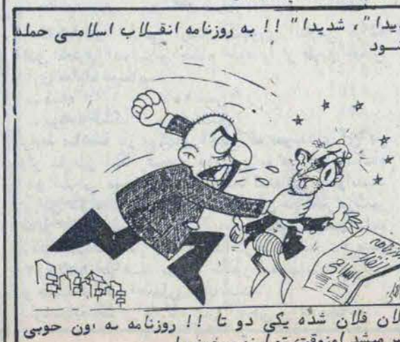
فلان فلان شده یکی دو تا ۱۱ روزنامه به اون حویب منتشر میشد اونوقت تو اینو میخونی!

اقدامات متجاوزانه ویا حمله یا اسلحه سرد است- جانب این است که اتهام یکی از خواهران سرودست پویا شکسته و پدیده کوفته و مروح به دادگاه آوردند و در همین رابطه دو نفر از خواهران به شدت متضرر شده بودند که یکی را نتوانستند به دادگاه بیاورند و دیگری نیز قادر نبود استادن و صحبت کردن بود. دوشنبه شب تعداد ۲۴ نفر را در یک سلول ۳ متری به مدت ۳ ساعت محبوس ساخته و جریان گرمای غیر قابل تحمل را به داخل باز کرده بودند. در دادگاه دانشجویان اکثریت در میان نام و مشخصات خود اصناع ورزیدند و ابراز داشتند که تا حضور نماینده دولت ایران و وکیل مورد اعتمادشان سخن نخواهند گفت. از رفتار وحشیانه پلیس با دانشجویان قبلی تهیه شده بود که پلیس آری به همراه دوربین توفیق نمود و نیز دانشجوی دیگری را که در حال عکسبرداری بود دستگیر کرد. دانشجویان از دیشب اعتصاب غذا کرده و گه‌گاه تا آذوقه برادران و خواهرانشان در برادران و خواهرانشان در آورده داد. این اعتصاب ادامه خواهد داد. اینها تا ساس دانشجویان بی احترامی به پلیس جلوگیری از