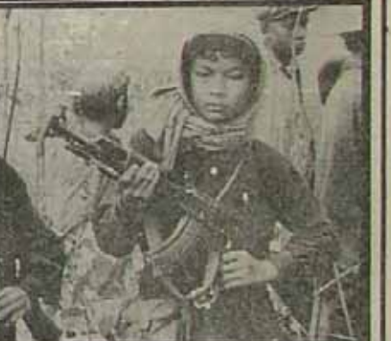
نوجوانان مبارز اریتره

سرزمین اریتره با ۴ میلیون جمعیت در شمال انبوسیتی و در کنار دریای سرخ واقع شده است و تنها راه گور انبوسیتی دریای سرخ بحساب می آید این سرزمین از سال ۱۵۵۲ تا بعد از تصرف متعاصر درآورد انگلیس و فرانسه در دست انبوسیتی می باشد در فاصله سال ۱۹۴۹ تا ۱۹۵۰