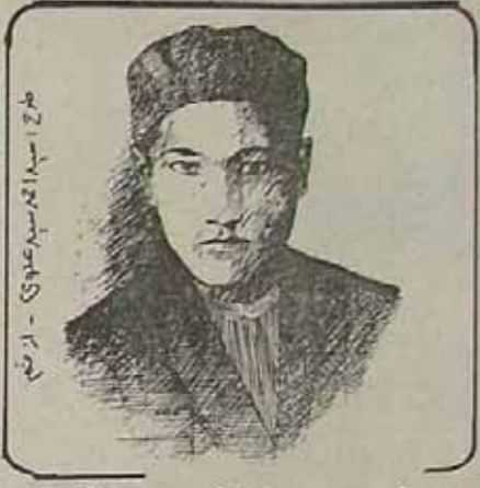
میر و تنزیل عینی

در حقیقت شهیدان آن دختر دلیر جادوگرشود و سیه سیرگرد و داد زد تاگس بزن منم من ایوانیم دوشیزای زینل دلیرانم