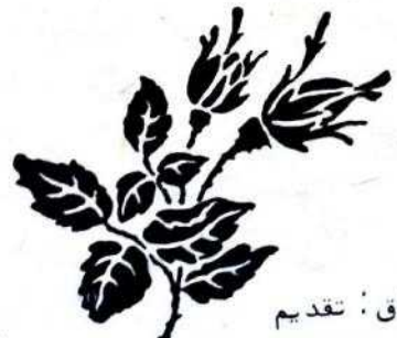
* سوناماق: تقدیم

-- آخی - بو ایش، بیرن امدار سلطانا یاراشان بر ایش دگیل دی . . . . - جانم! بو بر شاهانه " سیاست " میش. اگر " گوزل ماللا فاطما " لار و عشوه لی " مرجان " لار، غمزه لی " یاسمن " لر، امیر لری " سرگرم " اتمه سیدیلر، مملکت امن و امان اولماز دی و خلقین اوزو گولمزدی . . . . آشوب دوشردی!