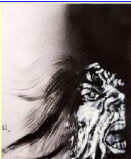
نقاشی از دلارا دارابی