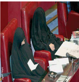
تاکید سه نماینده بر تدوین آیین نامه حجاب