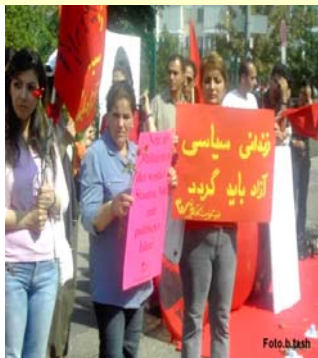
میتینگ اعتراضی در فرنگفورت- آلمان

زندانی سیاسی بی قید و شرط آزاد باید گردد! مرگ بر جمهوری اسلامی ۱۲ مرداد ۸۵ سازمان آزادی زن