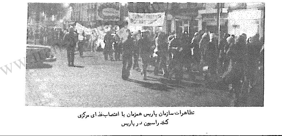
تظاهرات سازمان پاریس همزمان با اعتصاب غذای مرکزی کفر راسیون در پاریس

بقیه پیرویش . . . از بیرون زندان برای رفتای مبارز غذا تهیه نمید ( منطق سردسته مزدوران وحشی ) بر اثر مبارزات وسیعی که در تمام واحد های سازمان آمریکا دامن زده شد و جلب حمایت وسیع مردم یانکی ها مجبور شدند که قدم به قدم عقب نشینی نموده و رفتای ما را آزاد گردانند . مبارزات دانشجویان ایرانی در هوستن بار دیگر بزرگ زینی به تاریخ مبارزات پر افتخار کفر راسیون افزود . عقب نشینی که پلیس هوستن در مقابل این رفتا انجام داد اهمیت فراوانی دارد که به گفته خود آنها در تاریخ زندان این شهر بی سابقه بوده است . رئیس پلیس هوستن که بلافاصله پس از دستگیری رفتا اعلام نموده بود که مدت ها است در کین داد دانشجویان بوده است ، پس از چندی در مقابل وسعت مبارزات آنها در نهایت ضعف اعلام کرد که از این پس از آنها ( داد دانشجویان ایرانی ) خواسته خواهیم نمود که تظاهرات خود را " آرام " برگزار نمایند .