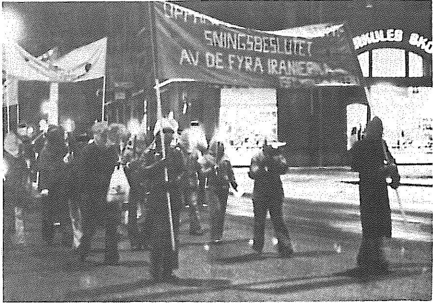
تظاهرات در لوند برای افشای توطئه ساواک - پلیس فرانسه / ۲۴ نوامبر