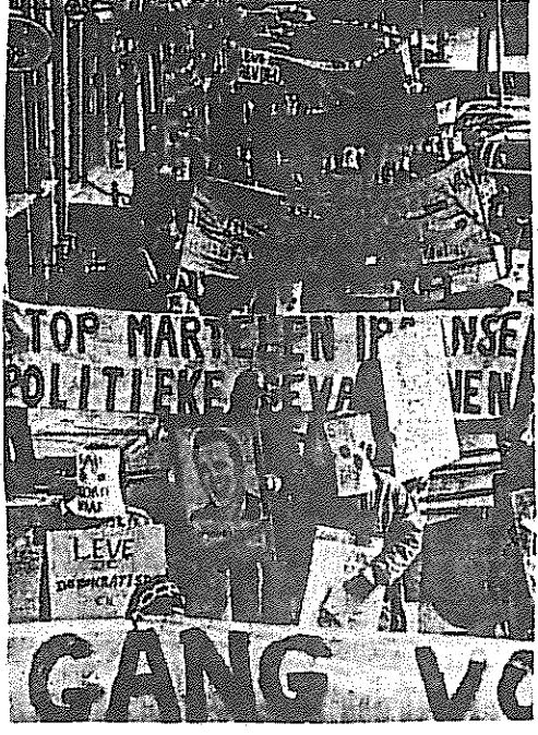
عکسی از تظاهرات مرکزی آمستردام همزمان با برگزاری کفرانس سازمان عفو بین المللی در این شهر

بیبوده نیست که مجله " لیوان " چاپ پاریس ارگسان راست ترین محافل امپریالیستی فرانسه خلاصه ای از مقاله میسر را در شماره ۲۸ فوریه خود چاپ نموده و بدینگونه پرده برجانیات شاه میاندازد . در خاتمه اضافه کنیم ورق پاره ای بنام " نشریه جوانان و دانشجویان دمکرات ایران " اودیسی - چاپ پاریس بتاریخ ۷ اسفند ۵۵ از گزارش میسر فاخرده معتقد است که این گونه تماسها و مصاحبه ها با زندان انبان سیاسی بهرحال جنبه هائسی از اختناق سیاسی ایران را علیه رژیم نمایل افشاء میکند . ضمن افشاء این نظرات و اطلاعات از ادعیه کمیته مرکزی حزب توده نظریات بغایت سازشکارانه آنان را محکوم میکنیم و اشاره میکنیم یک چنین تحلیلی از زندانهای ایران اتفاقاً " در سال گذشته توسط کمیته مرکزی بنام " ممان این آقایان " منتشر شده که توسط حساب شده ای بود از جانب منتشر کنندگان تا وضع تطبیقده های را از زندانهای ایران نشان داده حرکتی در جهت مخالف گزارش های رژیمندگان و انقلابیونی نظیر اشرف هفانی از همان زندانها را انجام دهد . اقدامات خائنانه کمیته مرکزی حزب توده همواره در جهت تطبیق بخششهای از ارتجاع و ایجاد سربل هائی برای هسکاربهای بعدی خود و پیاده کردن دستورات " کرملین " میباشد . در جهت افشاء هرچه بیشتر رژیم آدامس خانان پهلوی بکشیم ! محکوم باد اقدامات سازشکاران در هشتک آن ! زنده باد مبارزات زندان انبان سیاسی ایران در زندانها ! سرنگون باد رژیم مغفوری پهلوی سگ زنجیری امپریالیسم آمریکا !