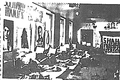
Janvier 1976. Grève de la faim d'étudiants iraniens à Paris pour protester contre l'assassinat de 9 de leurs compatriotes par le Chah

cel let l'i pa la Fr ira mc dé pu tre ble ira gri poi de ha