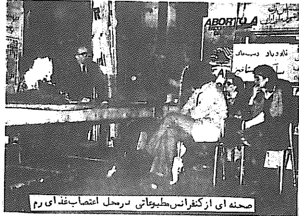
20 - novembre 1976