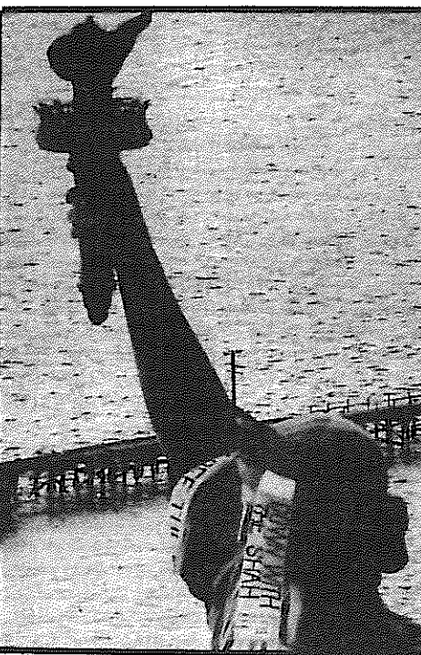
"مجسمه آزادی" در اشغال کفدراسیون

رژیم شاه از همن زمان که بدستور آریابان کاخ سفید ش حزب فاشیستی رستاخیز را علم کرد و زیر لوی این حزب شگه های غلظی ساواک را در همه جا پخش نمود و سخت کوشیده است تا با زیر و قلداری و تبلیغات و رشوه های بیش از همه با ضربه شلاق استبداد و توده مردم را بشترکت و پذیرش سیستم فاشیستی وادارد. شعبه های رستاخیز را زیر لوی سازمانهای "صنعتی" برپا کرده اند و برای محصلین و دانشجویان نیز از همین جامع دست پرورد ساواک که با جمع کردن مثنی هوراکند و تویاس سر هم شده است برآه انداخته اند و در همه جا کوشیده اند تا با برپا کردن این قبیل محافل توده دانشجویی حاصل را به زنجیر استبداد و کنترل ساواک گنندند. آنچه که رژیم شاه زیر لوی "صنعتی" علم کرده است و هیچ چیز مگر خدشه به منافع این رژیم خود بقدر صفحه ۲