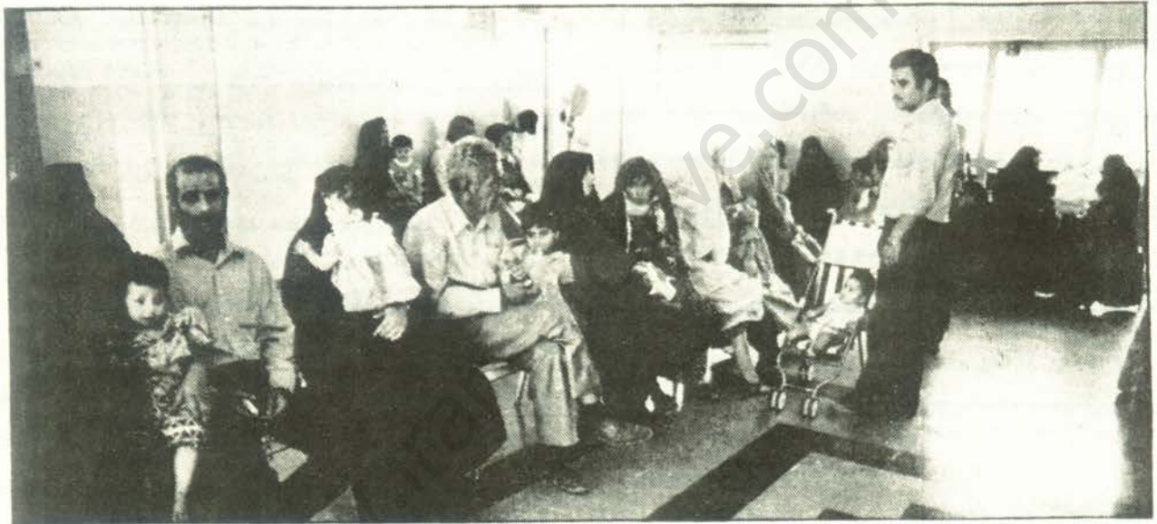
صحنه‌ای از انتظار طولانی مردم زحمتکش در بیمارستانهای دولتی

وضعیت بهداشت و درمان تحت حاکمیت جمهوری اسلامی به قدری وحیم است که انعکاس آن را حتی در آمار و ارقام دست کاری شده و تاءدیلی یافته رژیم نیز به خوبی می‌توان مشاهده کرد. طبق یک آمار رسمی دولت، در سال ۱۳۶۷ در ایران روزانه ۹۵۰ نفر به خاطر شرایط بهداشت و عدم دسترسی به امکانات درمانی جان خود را از دست داده‌اند. از این ۹۵۰ نفر، ۳۶۵ تن کودکان زیر ۵ سال بودند که ۱۳۰ نفرشان هرگز به ماه دوم تولد نرسیده و ۱۶۰ کودک دیگر قبل از یکسالگی مرده‌اند. بنا بر آمار دولتی در سال ۱۳۶۷، از هر ۱۰۰ کودک زیر