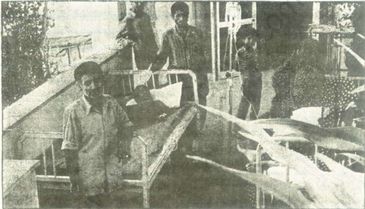
کمبود اتاق در بیمارستانها منجر به بستری کردن بیماران در軒راستها و راهروهای بیمارستانها می‌گردد.

بسیاری از بیمارانی که در اثر حوادث و یا بیماریهای گوناگون