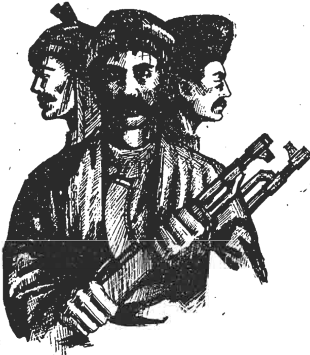
خلق مبارز کرد، در کنار سایر خلقهای دلاور ایران برای صلحی عادلانه و ایرانی آزاد و دمکراتیک مبارزه می‌کنند تا لحظه‌های عشق و صلح و آزادی را به ارمغان آورند.

در اطراف سنندج جنگ هنوز ادامه دارد، در طول شب نیز درگیری‌ها در شهر شدت می‌یابد. مردم شهر به ویژه زنان از تفتیش خانه‌ها به وسیله پاسداران جلوگیری می‌کنند.