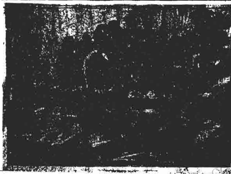
در فلسطین ، هر خانه ، اداره ، مدرسه و هرکجای نقطه این خاک ، سنگری است برای مبارزه . عکس ، رزمندگان جوان را در حال آموختن اسلحه نشان می دهد که آتش گلوله های آن قلب محتضر امپریالیسم امریکا را نشانه گرفته است .

خلق برای آزادی فلسطین در مصاحبه های بعد از شرح سیاست های صهیونیست ها می گوید : این سیاست های مستعمراتی نه تنها با منافع طبقه کارگر بلکه همچنین با منافع دهقانان خرده بورژوازی ، متخصصین و غیره و حتی بخش هایی