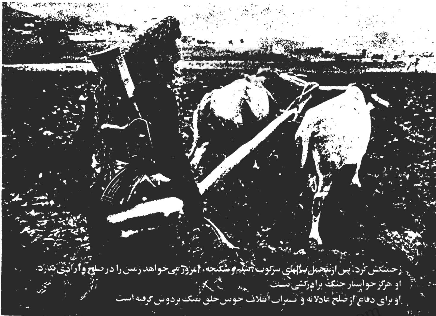
زحمتکش کرد، پس از حمل سلاحهای سرکوب و سنگین، امروز بی حواهد رسن را در صلح و آزادی نگارند. او هرگز حواسار جنگ برادرگی نیست. او برای دفاع از صلح عادلانه و سراب انقلاب حوس خلق شک بردوس گرفته است.

ته آربابا " در آغاز درگیری ها در پاوه توسط بهشمرگان کرد تسخیر شد و از آن به بعد ارتش تلاش بسیار کرد تا تپه را از دست بهشمرگان در آورد چرا که از نظر نظامی این تپه بسیار حائز اهمیت است و ارتش که تاکنون نتوانسته است در اثر مقاومت و مقابله بهشمرگان و خلق رزمندگانه در شهرها پیشروی کند، برای استقرار نیروهای خود و بمباران شهرها احتیاج دارد که تپه های اطراف شهر را تسخیر نماید به این جهت برای چندمین بار به تپه "آربابا" در پاوه حمله کرده و هر بار با به جا گذاشتن تلفات سنگینی ناچار به عقب نشینی شده است. در این روز نیز ارتش بار دیگر به تپه "آربابا" حمله کرد که با برجای گذاشتن چندین کشته و زخمی ناچار به عقب نشینی به پادگان شد و دو ارتشی مزدور نیز به اسارت بهشمرگان درآمدند.