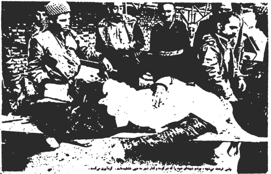
کشتار مردم کردستان

مردم سقر برای در امان ماندن از آتش خمپاره و بمب و توپ و راکت، خانه و کاشانه خود را رها می کنند و به شهرها و دهات اطراف می روند.