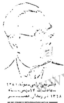
دکتر تقی ارانی (۱۳۰۱-۱۳۵۸) ۱۲ بهمن ۱۳۵۸ ۱۳۵۸ در زندان، تهران

یکی از درخشان‌ترین چهره‌های جنبش کمونیستی ایران، دوست رنجبران و دشمن ترلز ناپذیر امپریالیسم و سرمایه‌داری