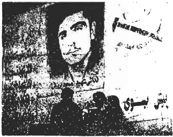
صحنه ای از مراسم بزرگداشت فدائیان شهید مسعود پرورش کاسجی، حاج شعبیهها، پشامی در قزوین.