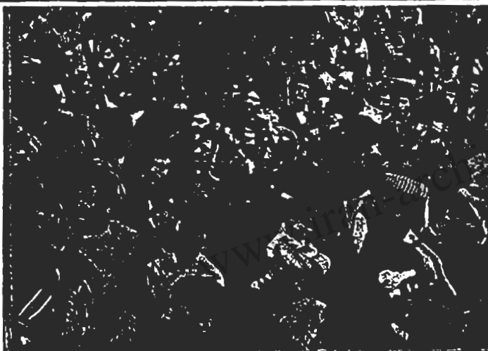
صحنه ای از مبارزات مردم سنجند که سرانجام به تشکیل شورای موقت منجر شد

بدران، مادران، به میدان سائید" ( بزبان ترکمنی ) . تظاهر کنندگان یکپارچه آزادی کلبه دگر شدگان در ترکمن صحرا را خواستار بودند. آنان خواهان آزادی فعالیت ستاد مرکزی شوراهای ترکمن صحرا، کانون فرهنگی سیاسی خلق ترکمن شدند.