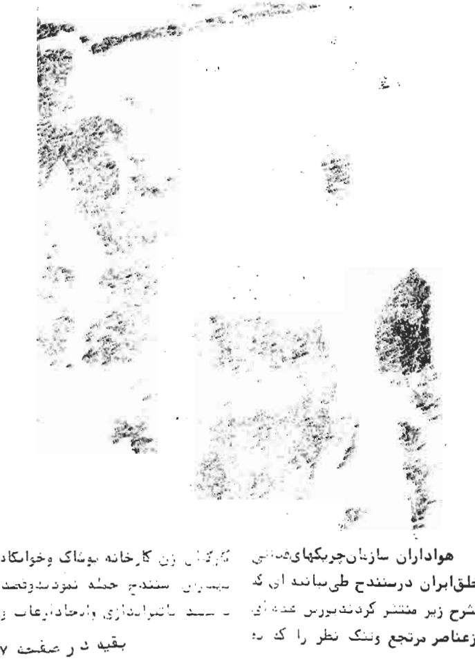
هواداران سازمان چریک‌های فدائی خلق ایران در سندانج طی بیانیه‌ای که شرح زیر منتشر کردند بر سر عده‌ای از عناصر مرتجع و تنگ نظر را که به