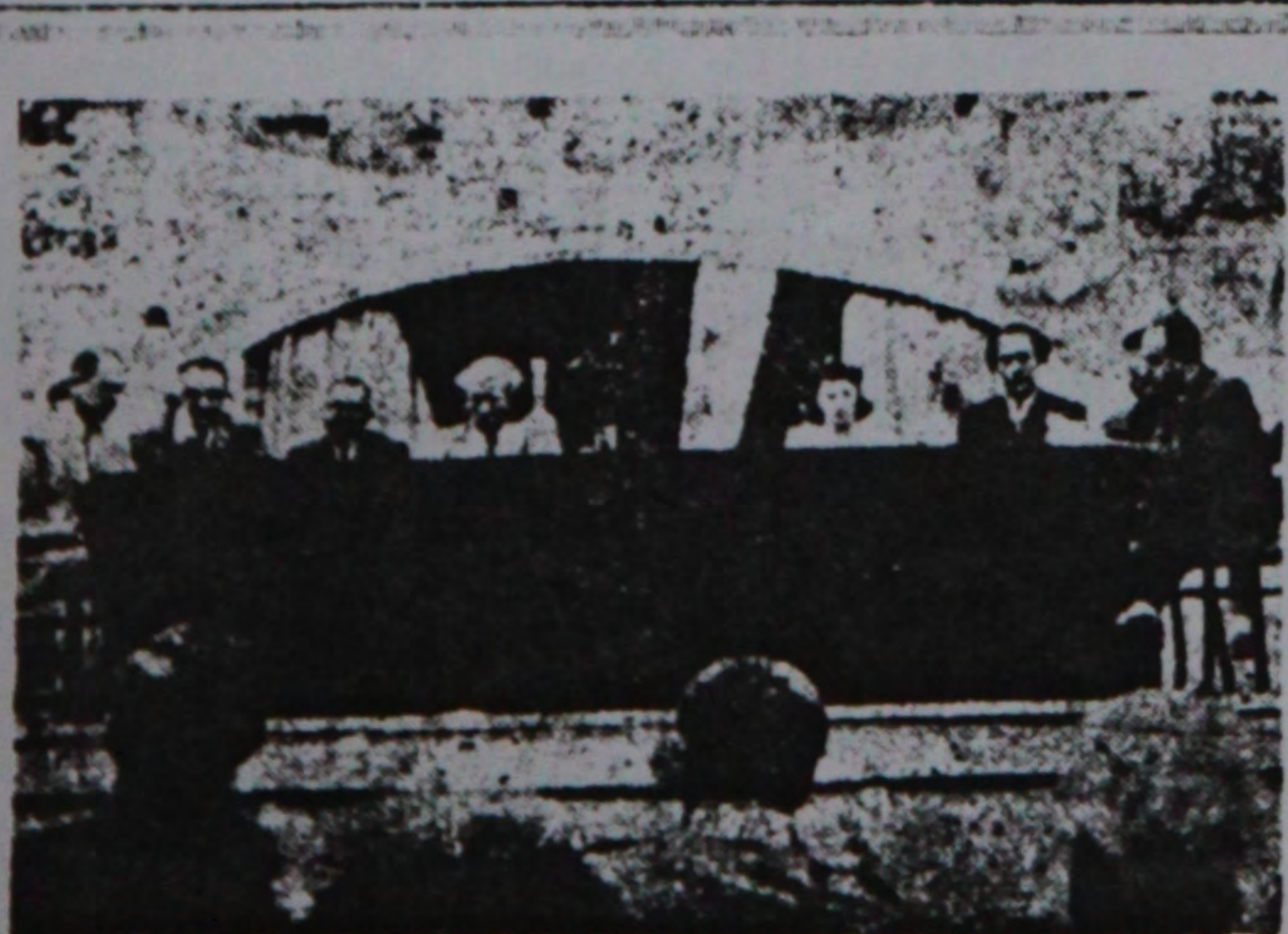
ایران یازچیلارینین کنکره سین جله لریندن

سوهت اتفافی دولتی اینده قدر دضارله پیشنهاد ایدیمیرکی بوتون آلمان کنترول آلتینا آلتینت و تحق اولونسون کی نه دوچه قدر ، آلمانی مسلح قوه لری و نظلمی تشکیلاتلارینین خلق سلاحی علی اولوبدر . سوهت اتفافی دولتی نظرنجه گره گلر بو منظورلر قالانی ۴ - نجی صحیفه ده