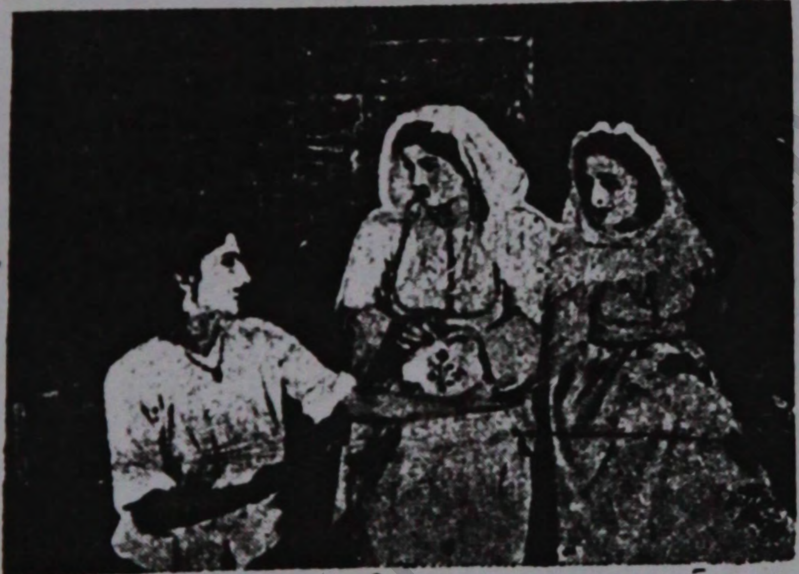
آرشین مال آلان ایسیندن بیر منظره

نوتری آرتیق مهله ویرمک ، دیکه لاریمو کیر یالتر آلمانین اسلحه سی و نظامی قومسینی آرادان آبارماللا ، دالمی صلحین و بین المللی امنیت دوام ناماسینا اطمینان تابان اولار . دورت طرفلی قرارداد که دنیا صلحی نامین ایشک ایچون طرح اولوب گرمک هامو فان آرتیق بو اقداملارا شامل اولسون . گرمک نظامی فکر و روحیه سنین نفوذینی آلمان ملتین گونلیک باها . بشندان چه ارماق ، بو جزایات برلن کنفرانسه مذاکره اولونوب و قرار آلبندی کی آلمانین سیاسی باهابشی دموکراس او زوره قورولسون و حال بو کی بو طرحه فاهست نور کوتلر - یی آرادان آبارماغا و آلمانیت حیاتیین تیجه یله ایشکد هیچ بیر اشاره اولونما ییدر ادهاملار نامر اولد بقلاری صورتده ، آلمانین متفق قوشونلاردان تخلیه ایدیللمسی نظره آلبندیر . لکن شاه گودونور که منتقلرین آلمانی