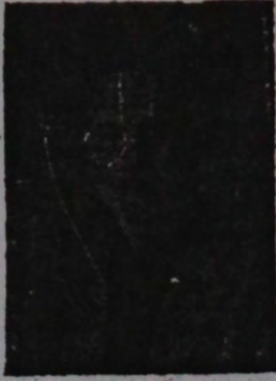
آذربایجان ملی مجلسین زنجان وکیل آقای قد علی نوکی

آذربایجان ملی تاریخی ساحه سندده بیر اقدام آذربایجان ملی تاریخی ساحه سندده بیر اقدام