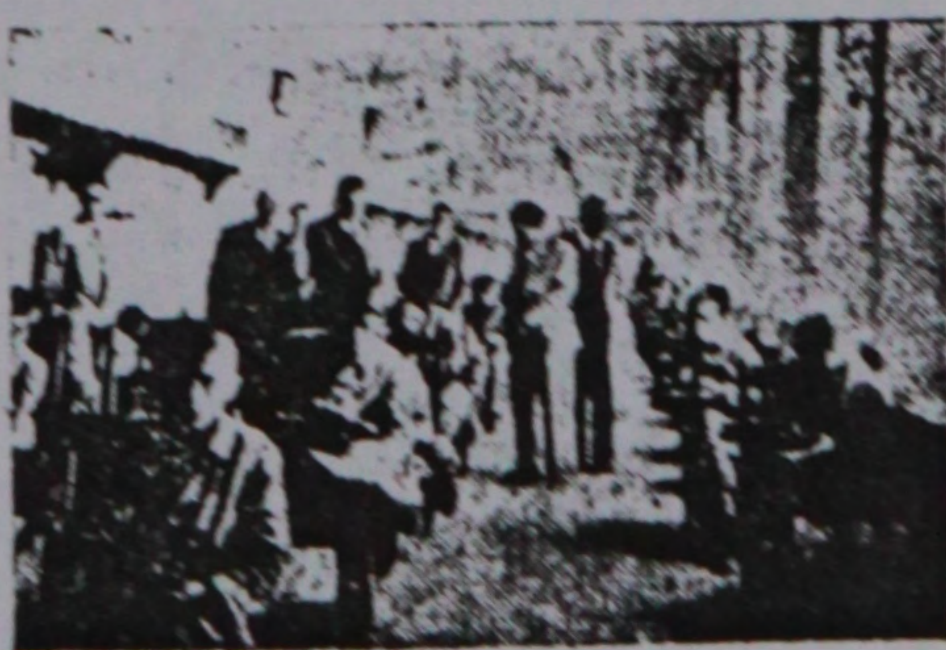
اوغلان محصللری آلتنجی ابتدائی کلاس امتحانندا

سووت تور : این جنوب قسمت لرینده مخصوصا اوکراپاندا باعلیق چوق اولوب و دورت گوت ادا تاپیشدی