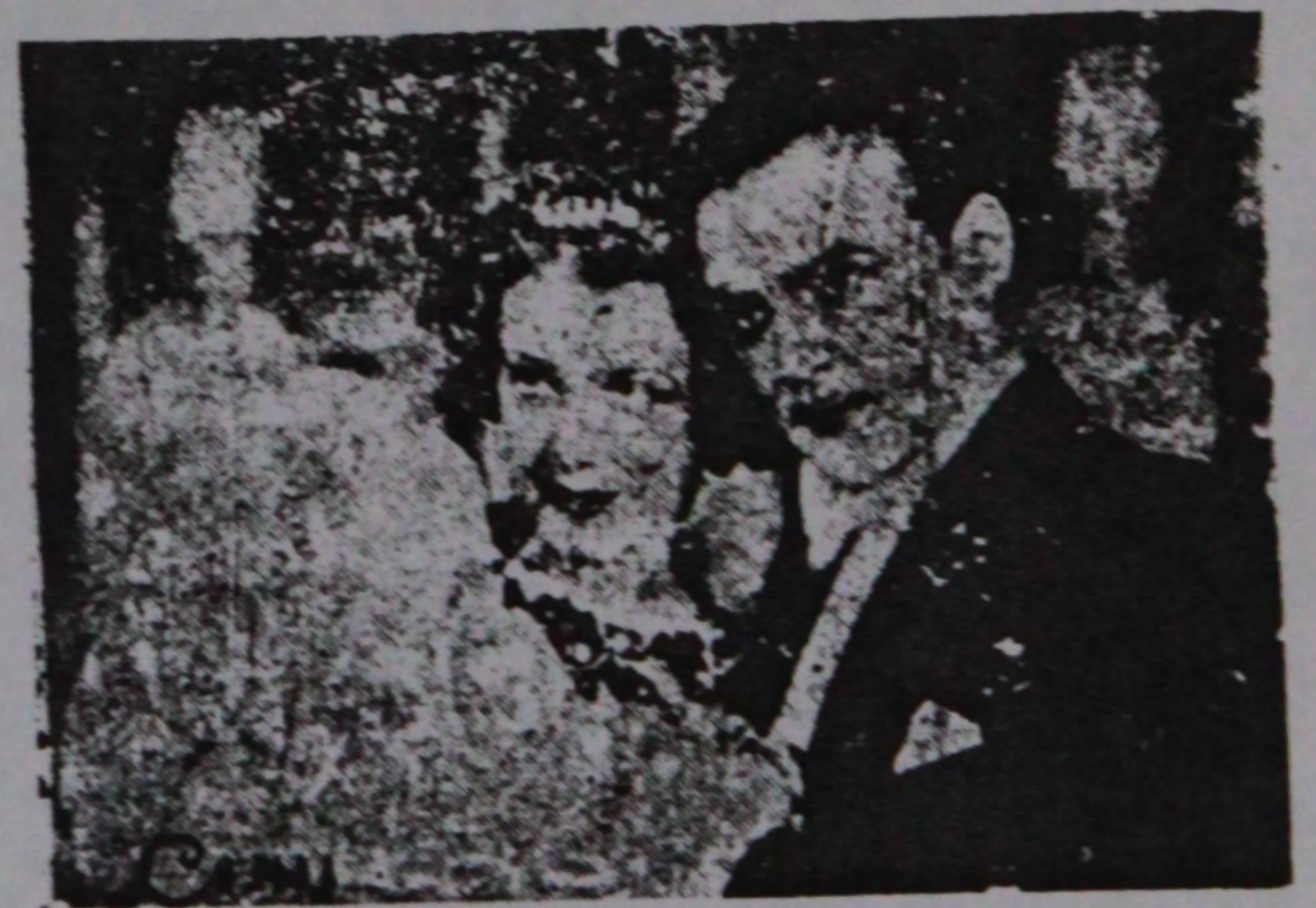
سیلوا آدلی سوونت بدی فیلمندن ایکی منظره