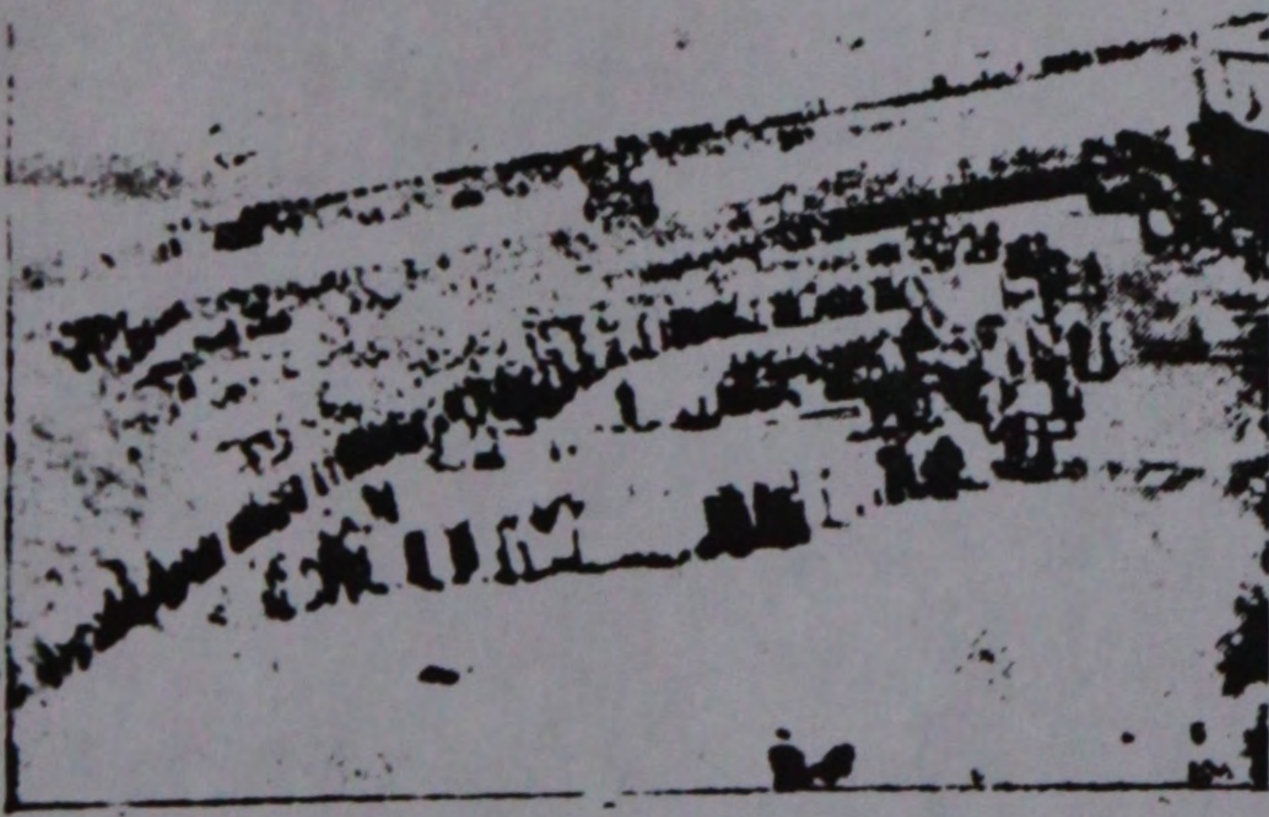
بو بوک نه ایش و هیئتینک دن ایکی منظره