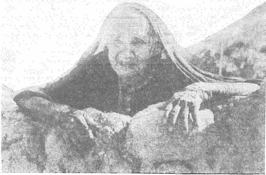
یکی از آسیب دیدگان سیل چاه بهار

در این تفاهم نامه، ۳۰۰ میلیون دلار بعنوان سقف اعتباری در خریدهای طرفین و ۴۰۰ میلیون دلار بعنوان سقف اعتباری اجرای پروژه های مشترک ساختمانی و صنعتی تعیین