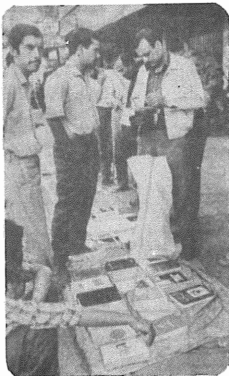
بساطکتابفروشی روبروی دانشگاه