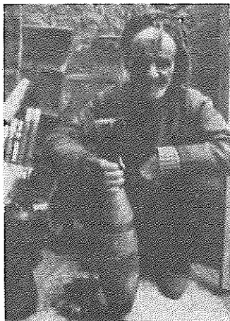
نصیب ما این بوده است!

ملیت‌های ساکن ایران هر کدام با ویژگیهای خاص خود خواسته‌هایی داشتند: ترکمن‌ها، بلوچ‌ها،... بویژه کردها، اما همه هر کدام بنوعی و بادرجاتی از خشونت سرکوب شدند، راستی زورمداری را اینها برگزیدند و برانگیختند؟