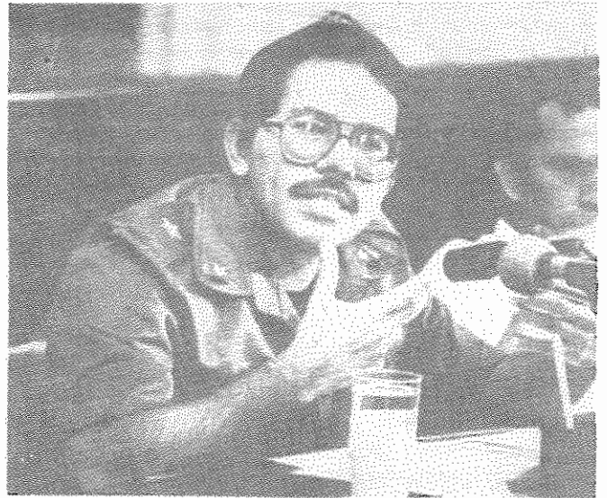
دانیل اورتگا: "همه چیز بهتر خواهد شد."