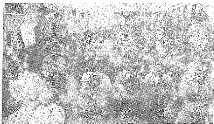
جمعی از معتمدانی که برای اعزام به اردوگاه کار اجباری توسط رژیم ایتادگستر جمهوری اسلامی جمع آوری شده اند

در عمان ولایتی همچنین با "یوسف بن هلوی" وزیر مشاور در امور خارجه این کشور دیدار و گفتگو نمود. ولایتی در این دیدار اعلام