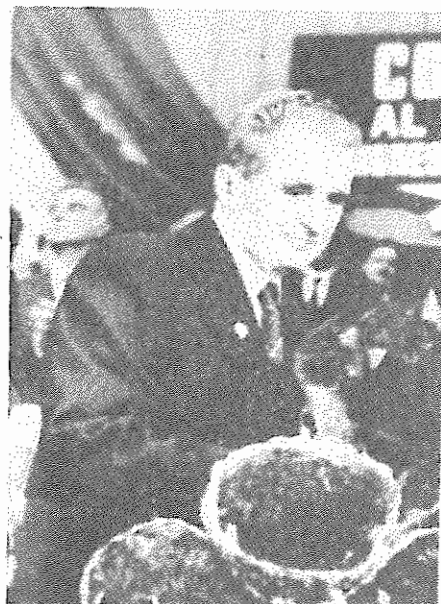
بقیه از صفحه آخر

می نویسد: «کسانی که پزیدنت معاود را کشته اند، وحدت لبنان و یگانگی مردم این کشور را به هلاکت رسانده اند. تصمیم بر آنست هر که را متحد میکند به قتل رسانند و هر که را انشقاق ایجاد می کند، حمایت نمایند».