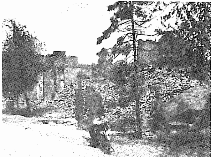
«مجاهدین افغانی» با پرتاب موشک های آمریکایی از راه دور مرگ و ویرانی می آفرینند.

بی نظیر بوتو، نخست وزیر پاکستان، برای نخستین بار شورشیان مسلح افغانی را فراخواند به وحدت رسیده و با دکتر نجیب الله، رهبر حزب دمکراتیک خلق و رئیس جمهور کشور، مذاکره کنند. وی که در فرستنده تلویزیونی بی. بی. سی. سخن می گفت اظهار داشت مجاهدین نباید فقط به عملیات نظامی پردازند بلکه باید به لحاظ سیاسی نیز فعال باشند. بوتو افزود احزاب عضو حکومت در تبعید مجاهدین باید به دوستان خود که