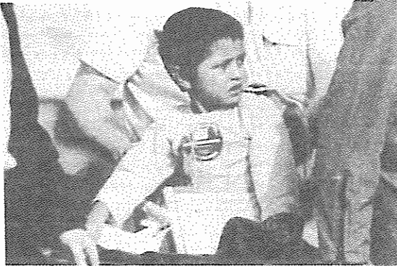
تمامی رنج جنگ از چشمان زیبایش هویدا است. یک کودک زخمی افغانی

در این میان وزیر خارجه آمریکا جیمز بکر گفت که در این مقطع تغییری در سیاست آمریکا در قبال افغانستان صورت نگرفته است.