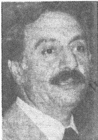
بیتمبر صفحه ۳

صبح روز جمعه ۳۰ تیرماه مراسم ادای احترام به دکتر عبدالرحمن قاسملو دبیرکل حزب دموکرات کردستان ایران و عبدالله قادری از رهبران این حزب در پاریس برگزار شد. تابوت حامل پیکرهای آنان از اتریش به فرانسه حمل شده و در مرکزی به نام انستیتو کرد قرار داده شده بود. از ساعت ۱۰ صبح مراسم ادای احترام آغاز شد. نمایندگان سازمان‌ها و