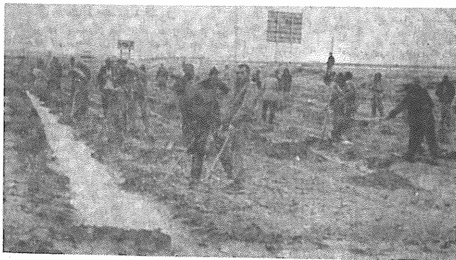
معتادان در حال کار در مسیر اتوبان تهران - قم

در ارتباط با طرح مذبور معاون فرمانده کميته های انقلاب اسلامی در روز دوشنبه گفت که در ماههای آینده ۵۰ هزار نفر به اردوگاه کار اجباری برای مدت ۶ ماه فرستاده خواهند شد تا ترک اعتیاد کنند. وی در این مصاحبه تعداد