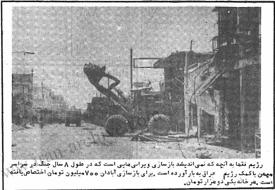
رژیم فقط به آنچه که نمی‌اندیشد بازسازی ویرانی‌هایی است که در طول ۸ سال جنگ در سرسبز مپمن با کمک رژیم عراق به بار آورده است. برای بازسازی آبادان ۷۰۰ میلیون تومان اختصاص یافته است. هر خانه یکی دو هزار تومان.

در حکومت آخوندها، سلسله مراتب آخوندی و رتبه‌بندی حوزه‌های جایگاه ویژه‌ای دارد. با وجود آنکه جدا کردن رهبری از مرجعیت به عنوان یکی از مصوبات "هیات بازنگری قانون اساسی" طرح شده است و مجلس خبرگان با انتخاب خامنه‌ای به عنوان رهبر عملاً به آن مبادرت ورزیده است، اما رژیم در تثبیت خامنه‌ای به عنوان رهبر نظام و قبولاندن آن به بیرونی‌های طرفدار و پایه اجتماعی خود با دشواری‌های جدی مواجه شده است. از طرف محافل ذی نفوذ مذهبی و "آیات عظام" به هیچ وجه آیت الله و "مجتهد مسلم" بودن خامنه‌ای پذیرفته نشده است و همه تبلیغات وسیع حکومت در این زمینه نیز نتوانسته است بر مخالفت‌ها سرپوش بگذارد. گسترده‌گی تبلیغات رژیم در بیعت گرفتن برای خامنه‌ای نیز خود به تنهایی پذیرفته نشدن خامنه‌ای به عنوان رهبر در بقیه در صفحه ۳