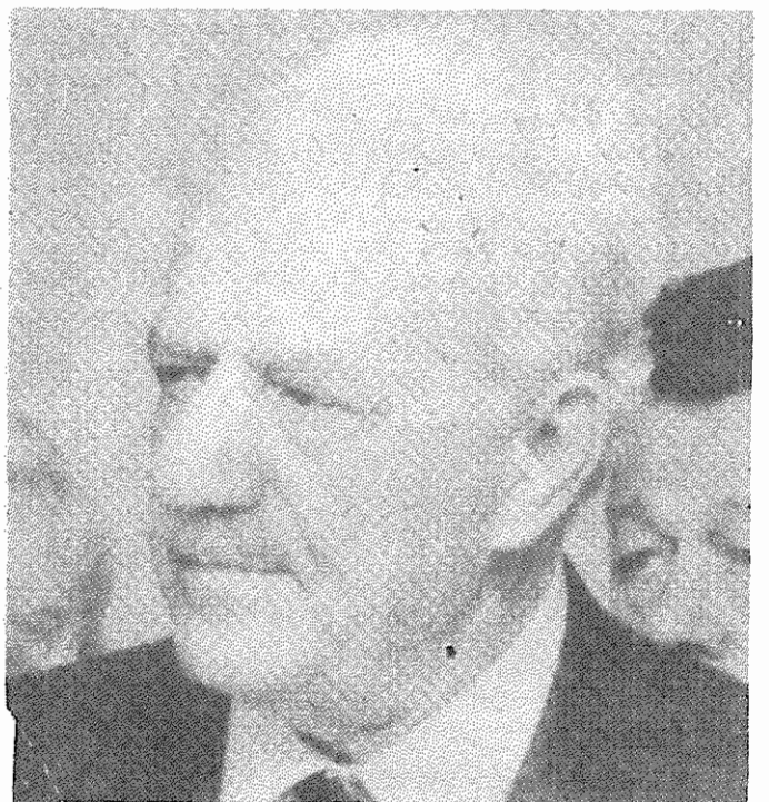
فلوراکیس، دبیرکل حزب کمونیست یونان

برای اشتراك تشریات «کار» و «اکثریت» در خارج از کشور فرم زیر را پر کرده و همراه با معادل بهای اشتراك، تمپرستی و یازسید بانکی پرداخت بهای اشتراك به آدرس نشریه ارسال نمایید: