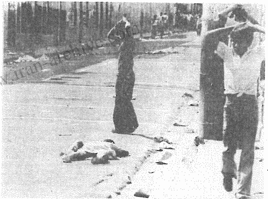
سرکوب خونین اپوزیسیون، کارکرد روزمره ارتش السالوادور است

بدنبال انتشار یک گزارش تلویزیونی درباره تولید یک موشک اتمی میان برد در آلمان فدرال، دولت بن دستور قطع این پروژه را داد. آلمان فدرال سلاحهای اتمی ندارد و طبق قرارداد بین المللی منع گسترش سلاحهای هسته ای مجاز به تولید این نوع سلاحها نیز نیست.