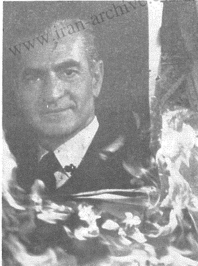
شعله ستم سوز، این شعله اکنون در قلب مردم حرارتی صد چندان یافته است و آتش بر بیت جماران خواهد افکند

این تجربه‌ها رجوع کنند و به مردم بگویند کدام داوری‌ها را باید ملاک