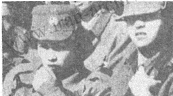
زنان مسلح عضو نیروی شبه‌نظامی مدافع انقلاب افغانستان

به گزارش خبرگزاری تاس، هم‌اکنون در شمال و غرب کابل، حدود ۶۰۰ گروه اپوزیسیون یک نیروی نظامی شامل ۱۷ هزار نفر متمرکز کرده‌اند. این گزارش می‌افزاید به استثنای واحد کوچکی که امنیت فرودگاه کابل را بر عهده دارد، همه نیروهای شوروی از این منطقه خارج شده‌اند و تجهیزات و پایگاههای خود را به نیروهای ارتش افغانستان تحویل داده‌اند. شمار غیرنظامیانی که در روزهای اخیر کشته شده‌اند، بسیار افزایش یافته است. در استان ننگرهار، اپوزیسیون مسلح می‌کوشد جلال‌آباد، مرکز این