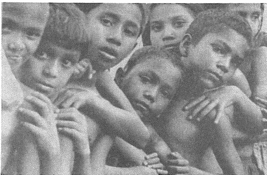
مصیبت دیدگان بنگلادش - وقوع توفان در سواحل بنگلادش به ویرانی چند شهر و روستا و مرگ هزاران تن، بخصوص ماهیگیرانی که با قایق در یارفته بودند، انجامید.

در هفته گذشته نیز درگیری میان افراد ارتش اسرائیل و مردم عرب ساکن مناطق اشغالی فلسطین ادامه یافت و به مجروح شدن ۱۱ تن از مردم انجامید. بنا به آمار رسمی، از آغاز «انتفاضة» (قیام خلق فلسطین) بیش از ۳۰۰ فلسطینی توسط ارتش اسرائیل کشته شده اند.