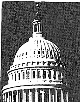
قانونگذاری است. ریگان در دوره اول ریاست جمهوری خود از ۱۹۸۱ تا ۱۹۸۴، ۳۹ بار از این حق‌وتو استفاده کرد.

در نخستین حکومت‌های پس از جنگ، نیروهای وابسته به مجتمع نظامی - صنعتی از طریق احراز سمت‌هایی مانند مدیر بخش و معاون وزیر در چند وزارتخانه دیگر به فیراز پنتاگون و به ویژه شورای امنیت ملی حضور داشتند. از هنگام انتخاب ریگان به رئیس‌جمهوری در سال ۱۹۸۰ نفوذ سیاسی آنها در نهاد ریاست جمهوری به کیفیت نوینی ارتقایافت. اکنون رئیس‌جمهور، مشاوران عمده او و وزیر خارجه از این زمره‌اند. مجتمع نظامی - صنعتی، بی‌انگرم اهمیت ضدخلقی و تجاوزکارانه دولت امپریالیستی است. این مجتمع، کل فعالیت موسسات دولتی مرکزی را تحت کنترل خود دارد و بطور فزاینده‌ای کل سیاست داخلی و خارجی ایالات متحده را تعیین میکند. همه برنامه‌های تسلیحاتی باید به تصویب کنگره برسد. اما ابتکار