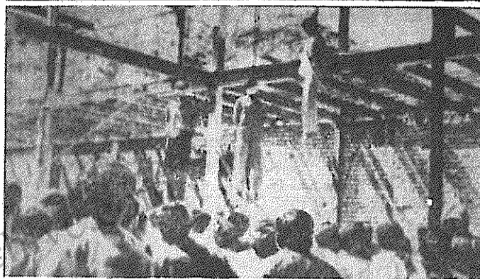
سه تن از مردم اسلام‌آباد که در ملامه به دار آویخته شدند.

هنوز هلیرفم گذشت هفت‌ها از آن روزهایی که در آستانه برقراری آتش‌بس، غرب کرمانشاه (باختران)، به قتلگاه بزرگ صدها تن از اعضا و هواداران مجاهدین و صحنه فجیع‌ترین جنایات مزدوران رژیم بنام عملیات "مرصاد" تبدیل شده، همه چیز در باره آن فجایع فاش نشده است. برقراری آتش‌بس که به حق، به شادمانی و امیدواری مردم