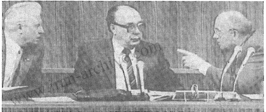
از چپ بر راست: یگور لینگاچف، الکساندر یاکولف، میخائیل گارباچف

دبیر کمیته حزبی شهر مسکو، بلیانف، گفت مردم مسکو از مشی حزب برای نو سازی و دموکراتیزه کردن، پشتیبانی می‌کنند، اما در همین حال دست رد به سینه همه آنها می‌زنند که تحت پوشش دموکراتیزه کردن، با سؤالات هوافمربانه، مردم را از کار خلاق و عملی باز می‌دارند و به هرج و مرج، دامن زدن به ناسیونالیسم و تقابل جویی سیاسی دعوت می‌کنند. وی تأکید کرد در شرایط پلورالیسم سوسیالیستی عقاید، ضروری است که حزب بیشتر به مسئولیت خود به مثابه پیشاهنگ سیاسی عمل کند.