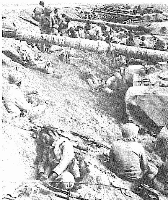
زرادخانه را شاید بتوان انباشته نگه‌داشت اما با سر بازان خسته چه می‌توان کرد.

هنوان یک "مرحله حساس" توصیف شده است. بیانیه شورای عالی پشتیبانی جنگ تاکید کرده است که سیاست رژیم همچنان "جنگ، جنگ تا پیروزی" است و همه امکانات مادی و انسانی کشور باید در خدمت جنگ قرار گیرد.