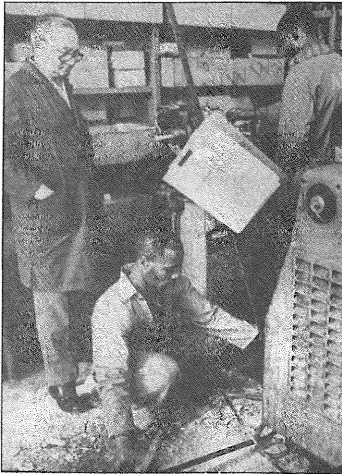
در کارخانه آ.ا.گ آفریقای جنوبی

روزنامه ویژه‌نامه‌ای دارد که هراز چندی با نام «اطلاعات جبهه» منتشر می‌کند. در این ویژه‌نامه، یک پاورقی به «بررسی هلال شکست ارتش نازی» اختصاص یافته است. زمانی بود که سرداران جنگی جمهوری اسلامی، برای طرح تاکتیک‌های جنگی خود، به «تجارب صدر اسلام» رجوع می‌کردند و مقالات بلند و بالایی، مثلاً در توضیح «تاکتیک پیامبر در جنگ احد» می‌نوشتند. حال پس از