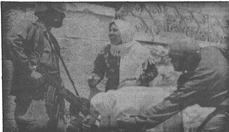
مزدوران ارتش اسرائیل، می‌خواهند یک جوان فلسطینی را در رام‌الله واقع در کرانه غربی رود اردن، اسیر کنند. دو زن فلسطینی، با سربازان درگیر شده‌اند.

هفته گذشته نیروهای اسرائیلی با استفاده از تانک و آتش توپخانه، وارد خاک لبنان شدند. به گفته منابع اسرائیلی، بیش از ۲۵۰۰ تن از نیروهای ارتش صهیونیستی به بهانه از میان بردن پایگاههای چریکهای فلسطینی تا نزدیکی مواضع نیروهای سوریه در دره بقاع پیش رفتند. اشغالگران، چندین روستا را با خاک یکسان کردند، شمار زیادی از مردم لبنانی و فلسطینی را به قتل رساندند و تعداد بسیاری را ربودند. در درگیری‌های صهیونیستها با مدافعان لبنانی و فلسطینی روستاهای حداقل سه سرباز اسرائیلی کشته شدند.