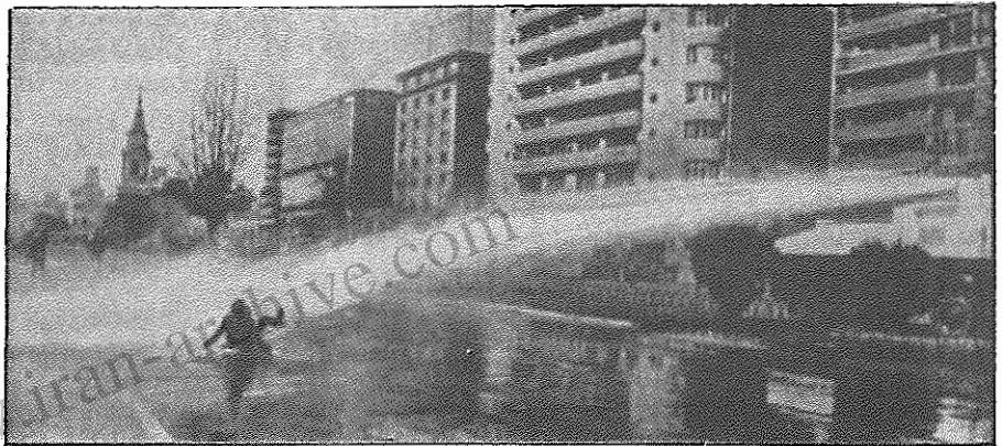
صحنه ای از هجوم نیروهای سرکوبگر پینوشه به یکی از اجتماعات اعتراضی مردم شیلی

نجیب الله رئیس جمهور افغانستان در راس یک هیات عالی رتبه از هند دیدار کرد. در مذاکرات رهبران افغانستان و هند، هر دو طرف اتفاق نظر داشتند که توافقی ژنو میان افغانستان و پاکستان، امکان احیای صلح و هادی شدن اوضاع منطقه را فراهم می کند. رئیس جمهور افغانستان در سفر خود به هند بار دیگر تاکید کرد کشورش آماده برقراری مناسبات حسن همجواری با همه کشورهای منطقه، از جمله پاکستان، ایران و چین است. ونکاتارامان رئیس جمهور هند در دیدار با نجیب الله گفت هند آرزومند است افغانستان کشوری نیرومند، با ثبات و شیر متعهد باشد و افزود کشورش حاضر است به افغانستان در سازندگی این کشور یاری رساند. رئیس جمهور افغانستان طی دیدارشان از هند با راجیوگانندی نخست وزیر این کشور دیدار و گفتگو کرد.