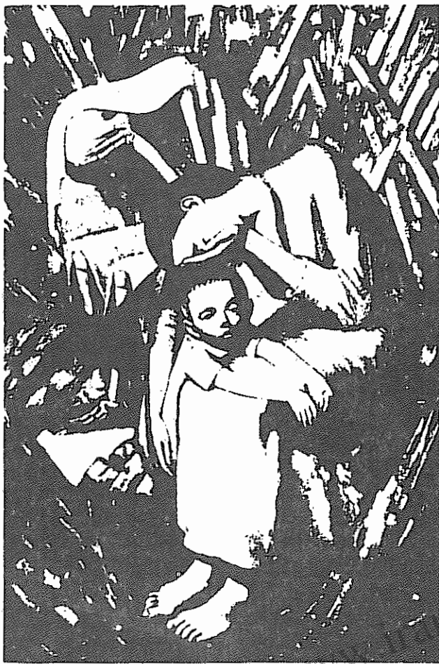
«مرگ در درسدن»، اثر ویلمم لاکنیت، ۱۹۴۵. درسدن، شهری در شرق آلمان، در جنگ جهانی دوم توسط نیروی هوایی انگلیس بدون هدف مشخص نظامی با خاک یکسان شد

مارکس ساعات زیادی را صرف بازی کردن با فرزندانش می‌کرد. دختران مارکس، نمی‌گذاشتند پدرشان در روزهای یکشنبه کار کند. اگر هوا خوب بود، همه افراد خانواده برای گردش به دامان طبیعت می‌رفتند. وقتی دختران مارکس کوچک بودند، او برای اینکه از طول مسافت خسته نشوند، برایشان قصه‌هایی که فی‌البداهه اختراع می‌کرد، می‌گفت.