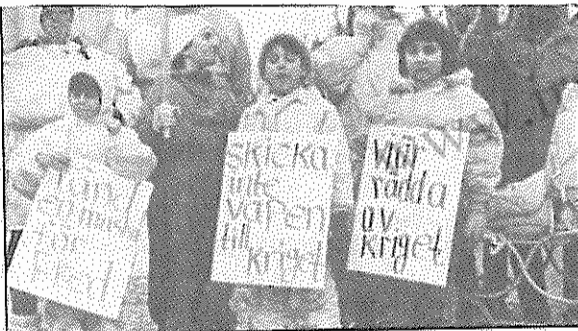
سوئد: کودکان ایرانی در صف تظاهرات علیه جنگ

* روز جمعه ۲۰ اسفند (۱۱ مارس) تعدادی از خیابانهای مرکزی شهر لولوشا در کمیته‌ای اعتراضی جمعی از ایرانیان مقیم این شهر بود. راهپیمایان با دست داشتن باندرول‌ها و پلاکاردهایی که شعارهایی چون "جنگ ایران - عراق را فکند، ما صلح می‌خواهیم" بر آنها نقش