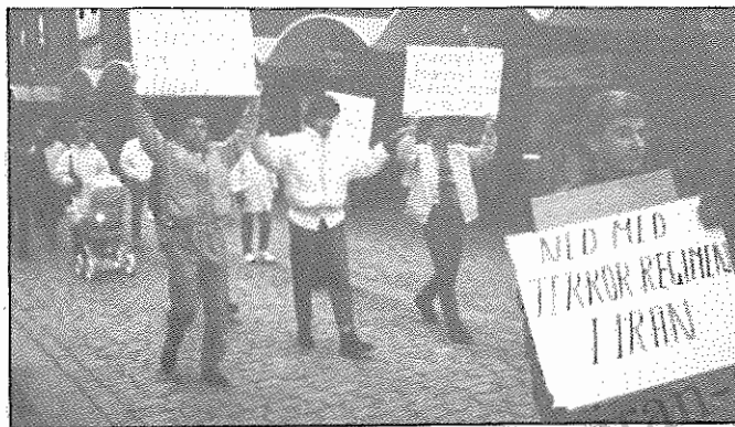
صحنه‌ای از تظاهرات ضدجنگ در شهر فالکن بری - سوئد

در محل تظاهرات پلاکاردهایی حاوی شعارهایی با خواست قله فوری جنگ شهرها و اجرای قطعنامه ۵۹۸ شورای امنیت و قطع ارسال سلاح به ایران و عراق دیده می‌شد.