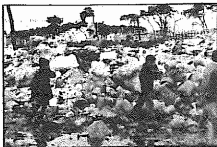
فقر در لبنان. سه کودک در میان زباله‌ها به دنبال مواد غذایی می‌گردند.

* واینرگر وزیر دفاع آمریکا، استعفا و کارلوجی، مشاور امنیتی ریگان، جای اورا گرفت.